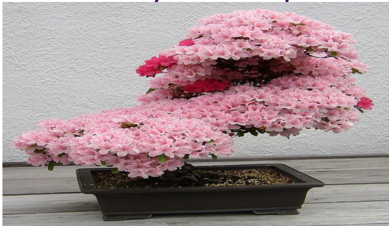
Cherry Blossom nở rộ

Một cây cảnh được tạo ra bắt đầu với một mẫu nguyên liệu gốc. Đây có thể là một công cụ cắt, cây giống, hoặc cây nhỏ của một loài thích hợp cho phát triển cây cảnh. Bonsai có thể được tạo ra từ gần như bất kỳ cây hoặc cây bụi loài cây thân gỗ có cuống dài ngày.