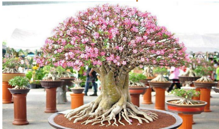
Chi Sứ sa mạc

Một cây cảnh được tạo ra bắt đầu với một mẫu nguyên liệu gốc. Đây có thể là một công cụ cắt, cây giống, hoặc cây nhỏ của một loài thích hợp cho phát triển cây cảnh. Bonsai có thể được tạo ra từ gần như bất kỳ cây hoặc cây bụi loài cây thân gỗ có cuống dài ngày.