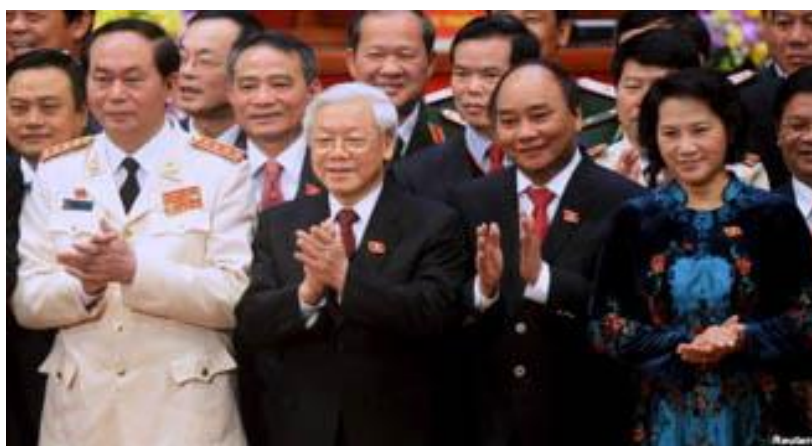
(Từ trái): CTN Trần Đại Quang, TBT Nguyễn Phú Trọng, TT Nguyễn Xuân Phúc, CTQH Nguyễn Thị Kim Ngân