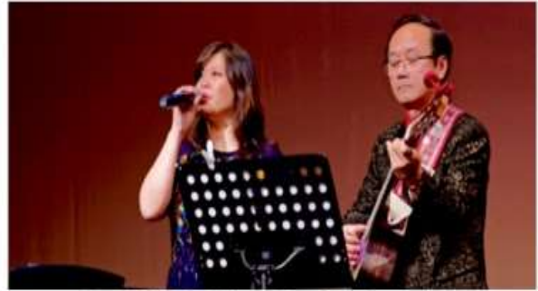
Ca sĩ Khánh Ly và nhạc sĩ Nguyễn Tuệ