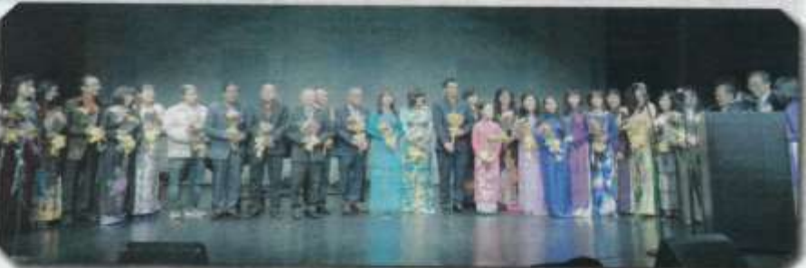
Tặng hoa các các ca , nhạc sĩ