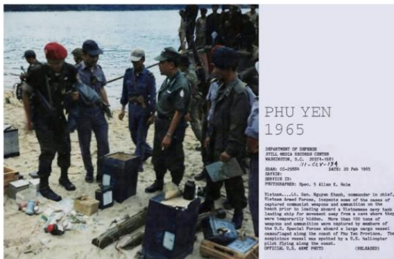
PHU YEN 1965 DEPARTMENT OF DEFENSE STILL MEDIA DIVISION WASHINGTON, D.C. 20315-1001 SERIAL: 05-0000 11-CP-274 DATE: 20 Feb 1965 SERVICES: 2A NOLA...Lt. Sen. Nguyen Khanh, commander in chief, Vietnam Armed Forces, inspect some of the cache of captured communist weapons and ammunition on the beach prior to loading aboard a Vietnamese war ship landing ship. For moment only from a view above they were unexpected. NOLA... More than 100 tons of weapons and ammunition were captured by members of the U.S. Special Forces along a large beachhead near Phu Yen along the coast of Phu Yen Province. The ammunition cache was seized by a U.S. helicopter from the beach. (RELEASED)