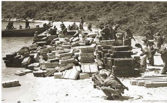
Weapon cache unloaded from VC sunken ship