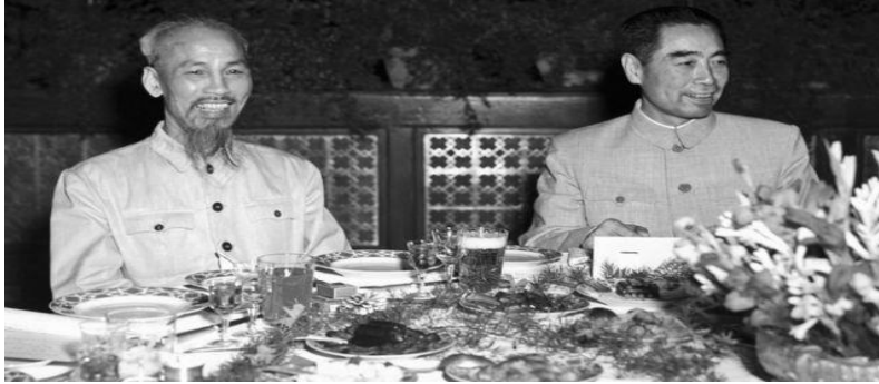
Chủ tịch Hồ Chí Minh của Việt Nam DCH và Thủ tướng TQ, Chu Ân Lai ở Bắc Kinh năm 1955