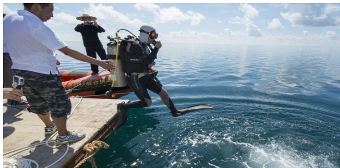
Hoàng Sa: người Trung Quốc đeo bình khí để lặn biển ở nơi được quảng cáo là bãi nước xanh đẹp tuyệt trần ở Vĩnh Lạc Đảo

Chiêu dụ du khách tới các hải đảo để thưởng ngoạn khung cảnh thần tiên: trời xanh, biển rộng, không phải ở chung cư chật chội, chen chúc như trên đất liền, lại dư thừa hải sản tươi sống, tất nhiên là sẽ rất thành công. Như vậy, chẳng mấy lúc phong trào di dân đến hải đảo sẽ bùng lên. Thế là nhiều nhà đầu tư từ bốn phương sẽ đổ xô vào các hải đảo.