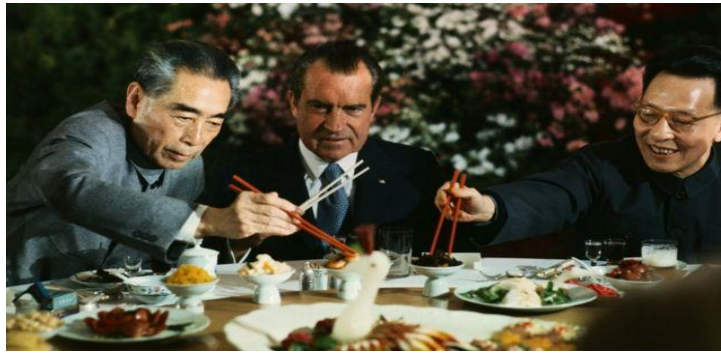
Thủ tướng Chu Ân Lai mở tiệc đãi Tổng thống Hoa Kỳ Richard Nixon sang thăm Trung Quốc năm 1972

"Và khi tôi sang Việt Nam với tư cách là đại diện của nước Trung Hoa mới tôi đã đi thăm viếng Hà Nội, tôi đã đích thân đến tận mộ hai nữ tướng ấy và đặt vòng hoa trên những ngôi mộ để tỏ lòng kính trọng của tôi đối với hai vị nữ anh hùng, họ là những người đã đánh bại tổ tiên chúng tôi là những người bóc lột." (Nguyên văn: And when I went to Vietnam as a representative of New China on a visit on North Vietnam, I went personally to the graves of these two women generals and left wreaths of flowers on the graves to pay my respects for these two heroines who had defeated our ancestors who were exploiters).