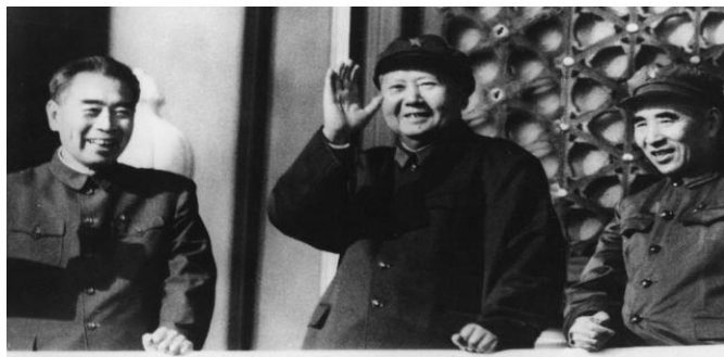
Chu Ân Lai, Mao Trạch Đông và Lâm Bưu trước khi Lâm bị hạ bệ

Trong thư ngày 5/04/1954), Tổng thống Dwight Eisenhower viết cho Thủ tướng Anh Winston Churchill: