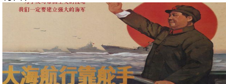
Trang tuyên truyền của TQ ca ngợi Mao Trạch Đông đặt ra mục tiêu phát triển Hải quân Quân Giải phóng

Câu hỏi đặt ra là nếu ông đã nói như vậy, tại sao ông lại để cho Trung Quốc tấn chiếm Hoàng Sa năm 1974?