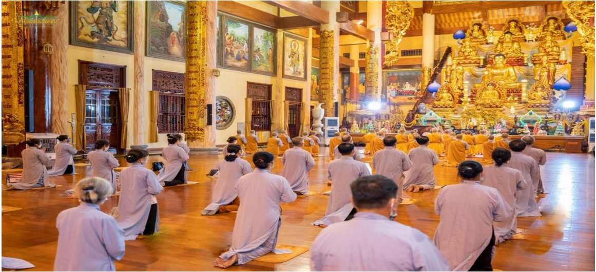
Hình ảnh chư Tăng Ni, Phật tử chùa Ba Vàng trong thời khóa sám hối (ảnh minh họa)