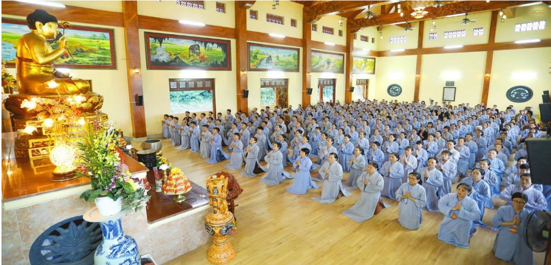
CLB Cúc Vàng - Tập Tu Lục Hòa là môi trường thiện lành giúp các Phật tử rèn luyện, phát triển thân tâm, trở nên hướng thiện hướng thượng