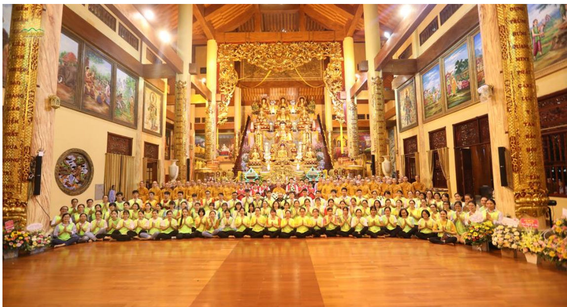
CLB Tuổi Trẻ Ba Vàng - nơi ươm mầm đạo đức và trí tuệ cho tuổi trẻ