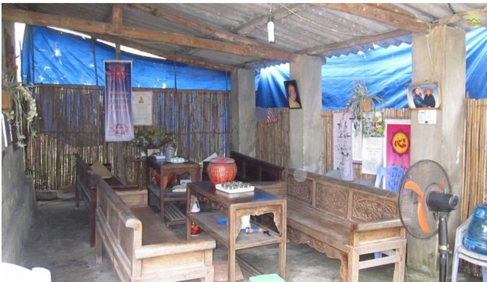
Căn phòng khách của ngôi chùa Ba Vàng cũ