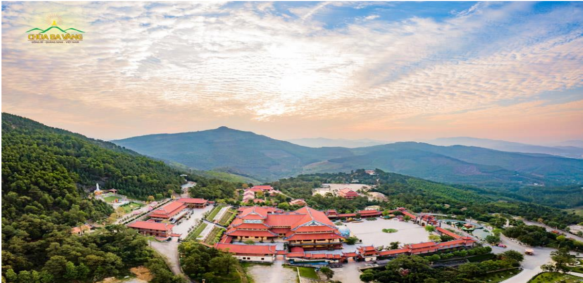
Chùa Ba Vàng - ngôi chùa nguy nga, tráng lệ trên non thiêng Thành Đăng