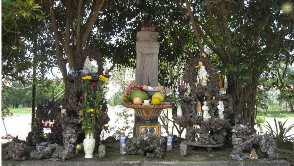
Cây hương đá khắc tên chùa và tên núi được coi là hiện vật đáng chú ý còn sót lại tại chùa Ba Vàng