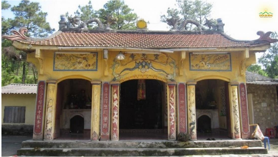
Chính điện của ngôi chùa Ba Vàng cũ