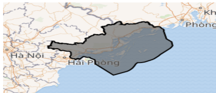
Bản Đồ Tỉnh Quảng Ninh ( https://vi.wikipedia.org/ )