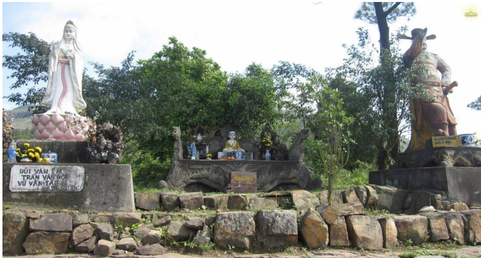
Nơi thờ tượng Ngài Quan Âm Bồ Tát và các vị có công với Tổ Quốc