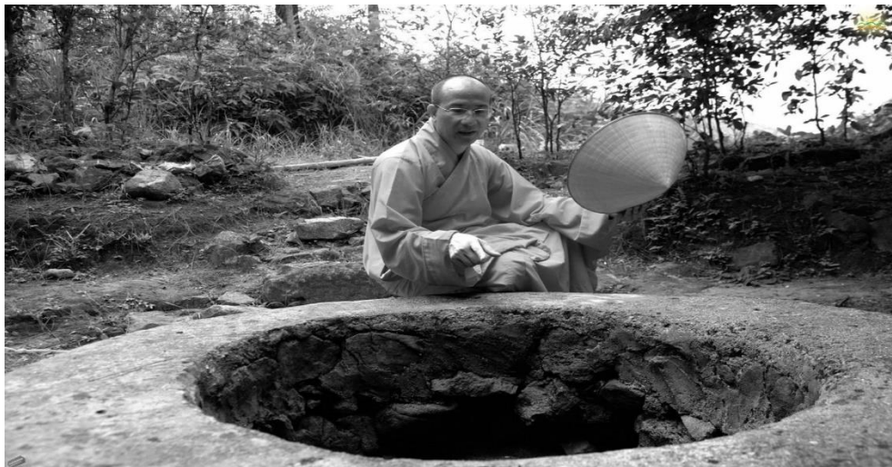
Giếng Thần đã xuất hiện tại ngôi chùa Ba Vàng từ lâu đời