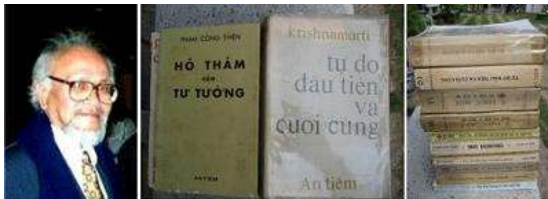
PHẠM CÔNG THIÊN và những tác phẩm để đời