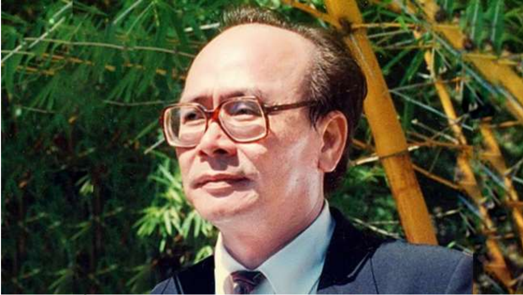
Nhà thơ triết gia Phạm Công Thiện [1941 - 2011]