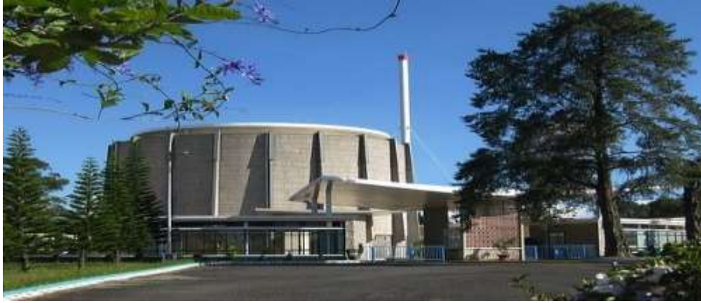
Viện nguyên tử Đà Lạt.

Viện nguyên tử Đà Lạt (Nay thuộc viện Năng lượng nguyên tử Việt Nam). Đây là lò phản ứng duy nhất ở Đông Dương do KTS Ngô Viết Thụ thiết kế. Thiết kế chính là lò phản ứng ở giữa, xung quanh là các phòng làm việc của viện hình vòng cung.