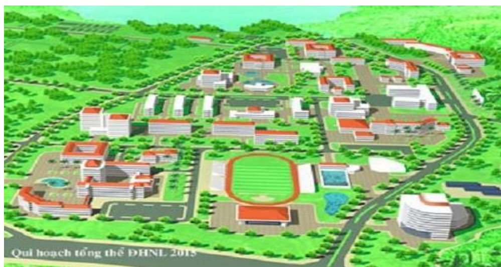
Mô hình ĐH Nông Lâm.

Ngô Viết Thụ cũng thiết kế chợ Đà Lạt với 3 tầng lầu, bố cục hình chữ H hài hòa, đẹp mắt, khiến chợ Đà Lạt luôn là điểm đến của khách du lịch thập phương.