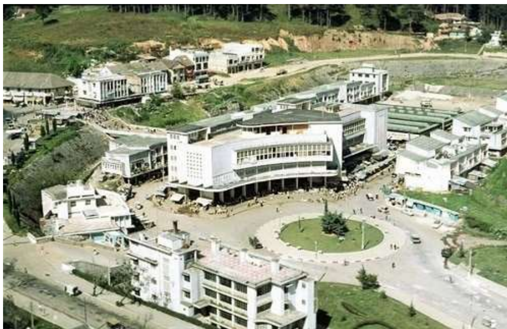
Chợ Đà Lạt năm 1970.

Ngô Viết Thụ cũng thiết kế chợ Đà Lạt với 3 tầng lầu, bố cục hình chữ H hài hòa, đẹp mắt, khiến chợ Đà Lạt luôn là điểm đến của khách du lịch thập phương.