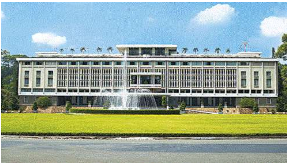
Dinh Độc Lập do Ngô Viết Thụ thiết kế.

Những công trình nổi tiếng Một trong những công trình lớn đầu tiên của ông được xây dựng là Dinh Độc Lập – biểu tượng của Sài Gòn lúc đó. Ông không chỉ thiết kế theo phương tây hiện đại mà còn kết hợp với cả kiến thức và văn hóa phương đông.