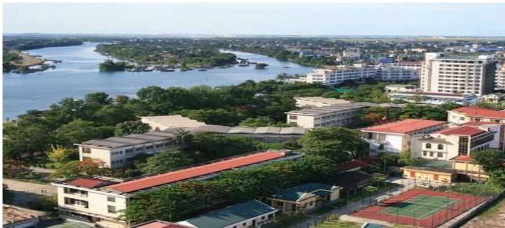
Trường Đại học Sư phạm Huế.

Viện nguyên tử Đà Lạt (Nay thuộc viện Năng lượng nguyên tử Việt Nam). Đây là lò phản ứng duy nhất ở Đông Dương do KTS Ngô Viết Thụ thiết kế. Thiết kế chính là lò phản ứng ở giữa, xung quanh là các phòng làm việc của viện hình vòng cung.