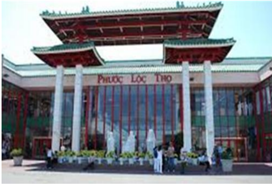
Phúc Lộc Thọ, trụ sở “Quốc hội Bolsa”