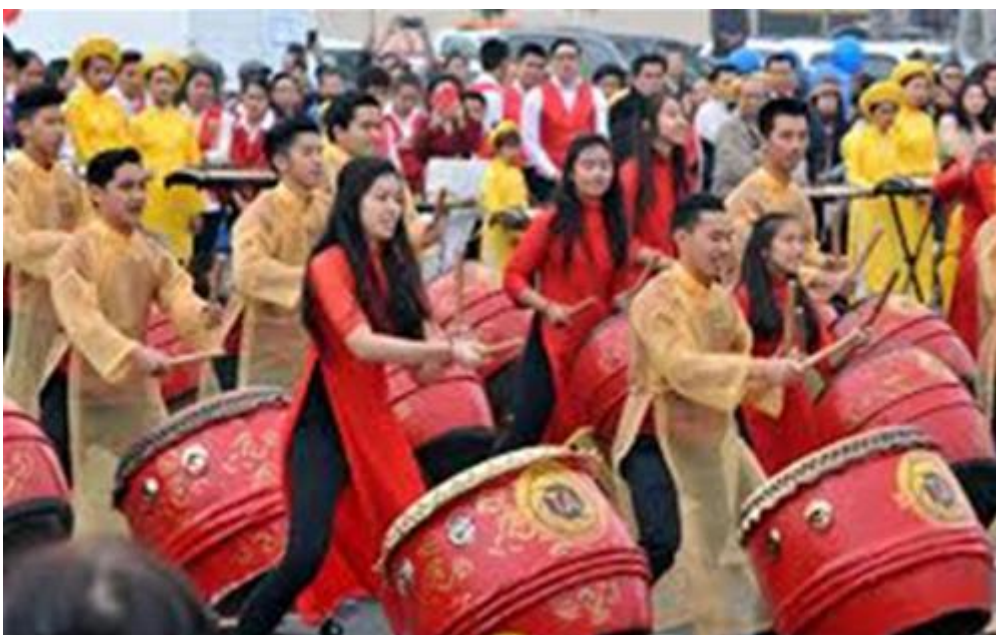
Diễn hành Tết tại Bolsa