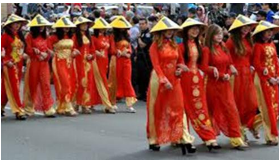
Bảo tồn “văn hóa dân tộc...”

“Thời đại Bắc thuộc dai dẳng đến hơn một nghìn năm, mà trong thời đại ấy dân tình thế tục ở nước mình thế nào, thì bây giờ ta không rõ lắm, nhưng có một điều ta nên biết là từ đó trở đi, người mình nhiễm cái văn minh của Tàu một cách rất sâu xa, dẫu về sau có giải thoát được cái vòng phụ thuộc nước Tàu nữa, người mình vẫn phải chịu cái ảnh hưởng của Tàu. Cái ảnh hưởng ấy lâu ngày đã trở thành ra cái quốc túy của mình, dẫu ngày nay có muốn trừ bỏ đi, cũng chưa dễ một mai mà tẩy gột cho sạch được. Những nhà chính trị toan sự đổi cũ thay mới cũng nên lưu tâm về việc ấy, thì sự biến cải mới có công hiệu vậy.”