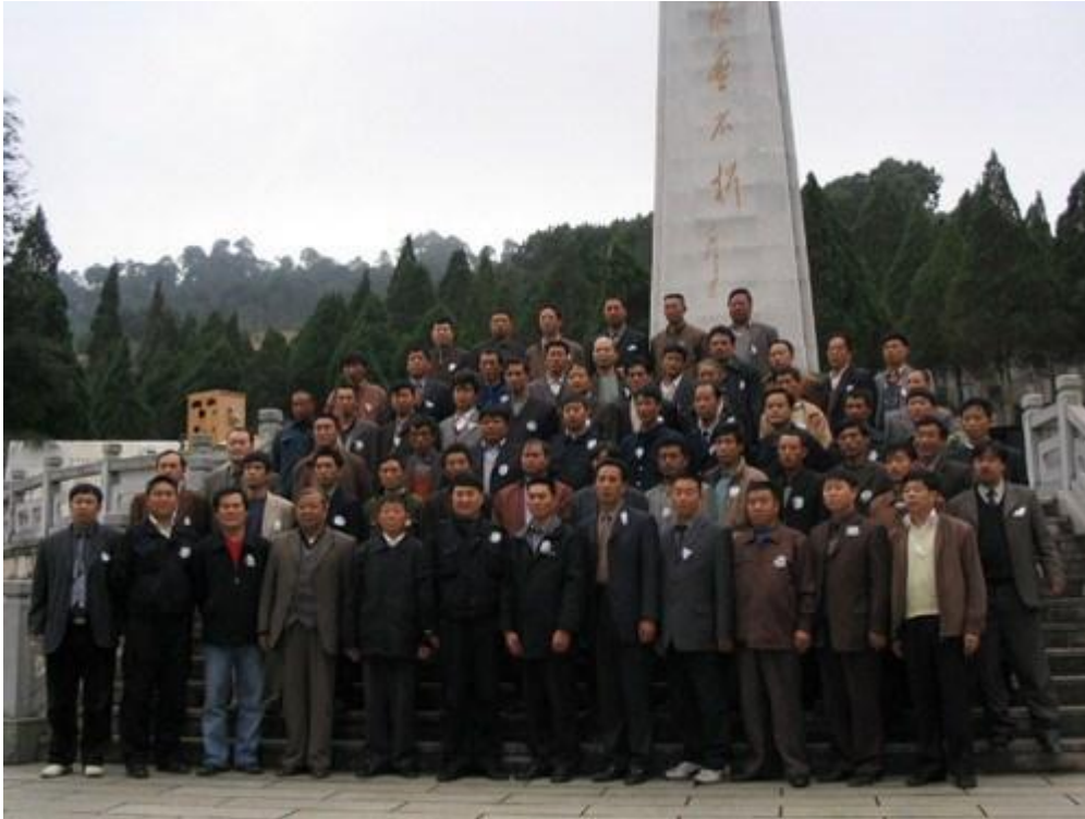
Các cựu chiến binh Trung Quốc tham dự triển lãm Núi Lão Sơn (đỉnh núi 1509) chụp hình lưu niệm trên đỉnh Núi Lão Sơn... nay thuộc về Trung Quốc...