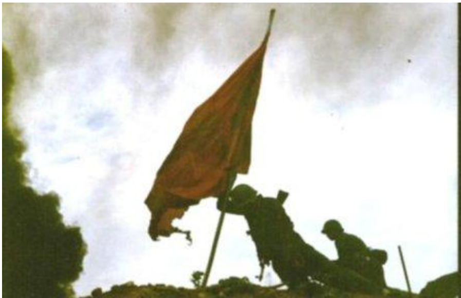
Lính Trung Quốc bố trí trên đỉnh 1509

Trong suốt thời gian trước hiệp định ngừng chiến ở Việt Nam thì Lão Sơn và Gi Âm Sơn của công nhân là lãnh thổ của Việt Nam. Lão Sơn với cao độ 1422.2m so với mặt biển là một vị trí chiến lược quan trọng trong phiến quân lực lượng trong suốt lịch sử cuộc chiến ở Việt Nam. Đây có thể giám sát con đường huyết mạch chính trị Hà Giang của Việt Nam sang Trung Quốc.