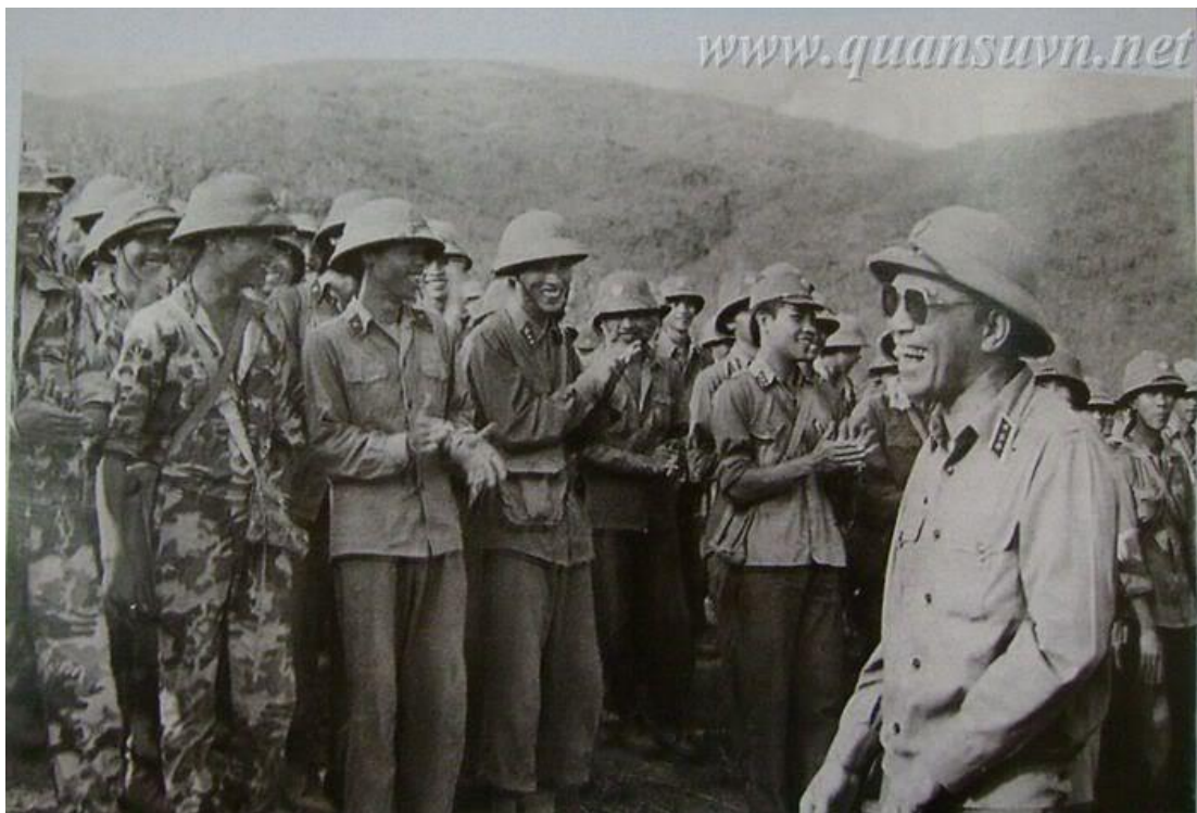
Th ng t ng oàn Khuê th sát chi n tr ng...

CU C CHI N T I M T TR N V XUYÊN-HÀ TUYÊN QUA H I C C A M T S C U BINH: