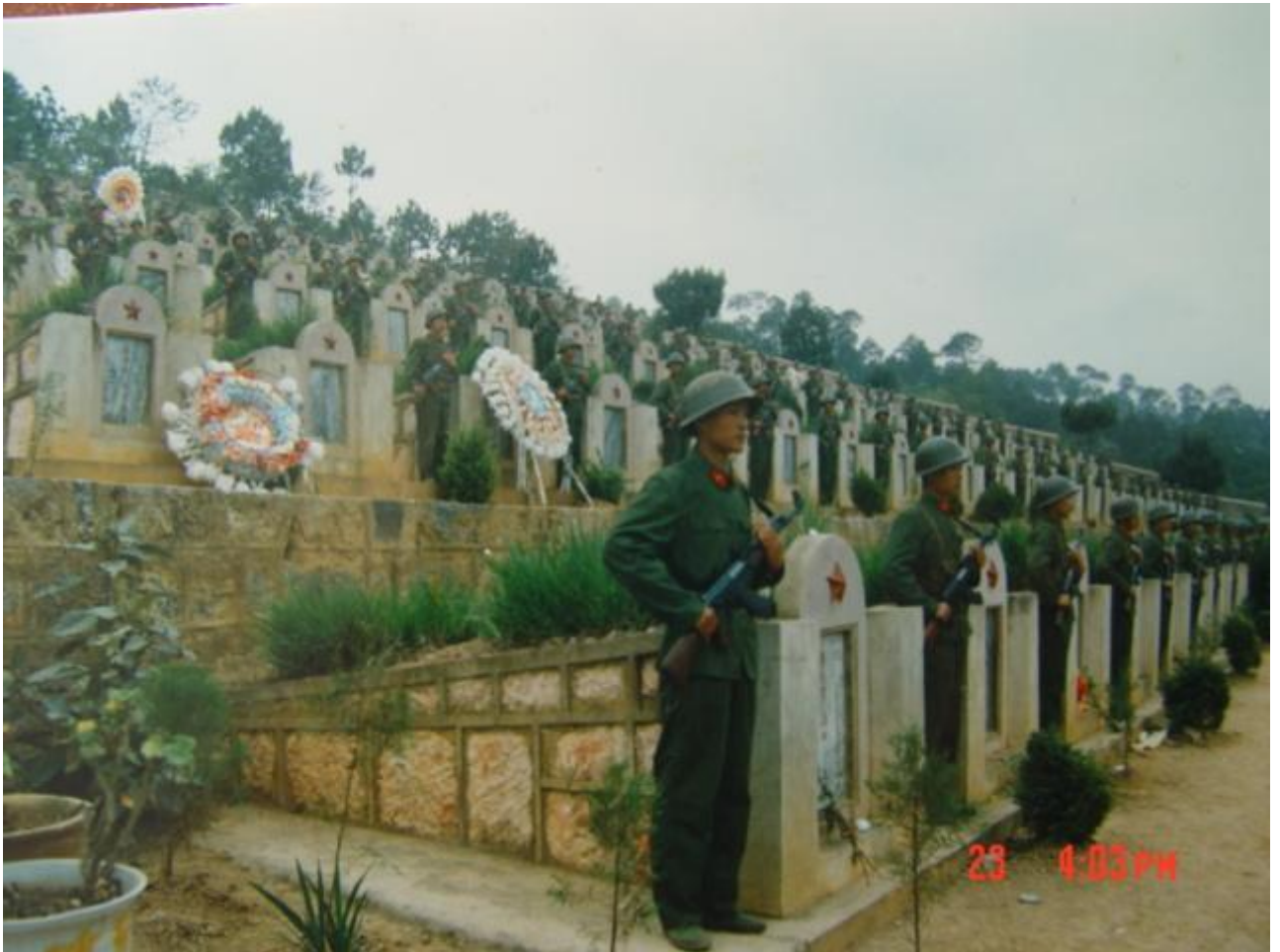
Ngh ĩa trang lính Trung Qu ố c ch ết trong tr ận ánh Lào S ố n 1984...

(Tr ờng Sa) vào tháng 3 n ăm 1989 thì có th ể nói là quân ội Vi ệt Nam ã ánh m ặt v ề th ực a mình Ậ Châu, Vi ệt Nam ã b ỏ các chuyên gia quân s ố ánh giá không còn là m ột ội quân m ạnh và thi ệt n ạn nh ất trong vùng ồng Nam Ậ n ạn.