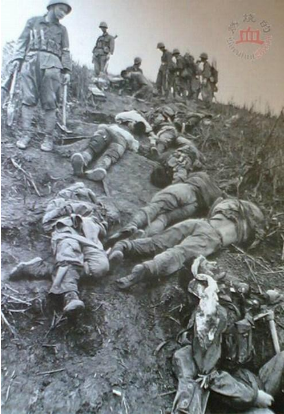
Lính Trung Quốc đang c nh nh ng ng i lính Vi t Nam ã anh d ng hy sinh vì t n c

K ho ch hành quân nh m chi m l i Cao i m 1509 có m t danh là " MB84, thu h i lãnh th " ã c v ch công phu. Tuy nhiên, c t ng V n Ti n D ng và các c v n quân s Liên Xô c ng không ng là h ã b bán ng b i m t s quan cao c p ph n b i?