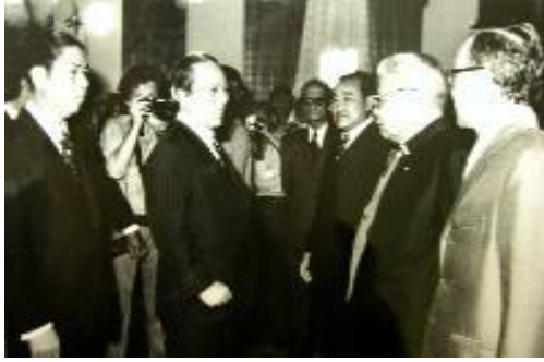
Thủ Tướng VNCH Nguyễn Bá Cẩn đang giới thiệu các thành viên trong Tân Nội Các lên Tổng Thống Nguyễn Văn Thiệu ngày 14-4-1975.