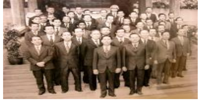
Tân Thủ Tướng Nguyễn Bá Cẩn (hàng đầu bên trái) và các thành viên trong Tân Nội Các (hàng sau bên trái) chụp chung với cựu Thủ Tướng Trần Thiện Khiêm (hàng đầu bên phải) và các thành viên trong Nội Các cũ vừa giải thể (hàng sau, bên phải).