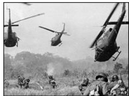
Quân Mỹ sử dụng thông tin tình báo để tiến hành các cuộc tấn công

Thông tin mà ông Ba cung cấp thường xuyên được sử dụng trong các đánh giá của tình báo Mỹ về kế hoạch của phe cộng sản. Ngoài ra, mặc dù Ba chuyên môn theo dõi các khía cạnh chính trị chứ không phải quân sự, nhưng thỉnh thoảng ông cũng báo trước các cuộc tấn công ở khu vực Tây Ninh.