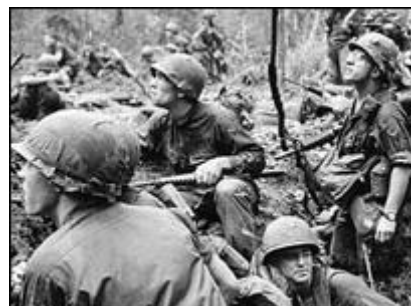
Quân đội Mỹ sử dụng nhiều tình báo trong cuộc chiến Việt Nam

Bài này đã đọc tại hội thảo “Tình báo trong Chiến tranh Việt Nam”, ở Trung tâm Việt Nam thuộc Đại học Công nghệ Texas.