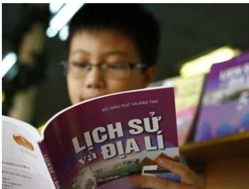
Tích hợp môn lịch sử với những môn khác trong chương trình sách giáo khoa, ảnh minh họa.

Theo báo Giáo dục, GS Vũ Dương Ninh cho rằng việc chọn lọc các sự kiện thì cuộc đấu tranh bảo vệ biên cương của tổ quốc, cả đất liền và hải đảo, đều là sự kiện rất quan trọng, không thể không nói tới. Sách giáo khoa Lịch sử phải tôn trọng sự thực khách quan này, vì thế cần phải viết các sự kiện đấu tranh bảo vệ biên cương của tổ quốc trong SGK, vì tính khách quan của lịch sử, tính giáo dục truyền thống của sử học và vì yêu cầu, đòi hỏi của xã hội.