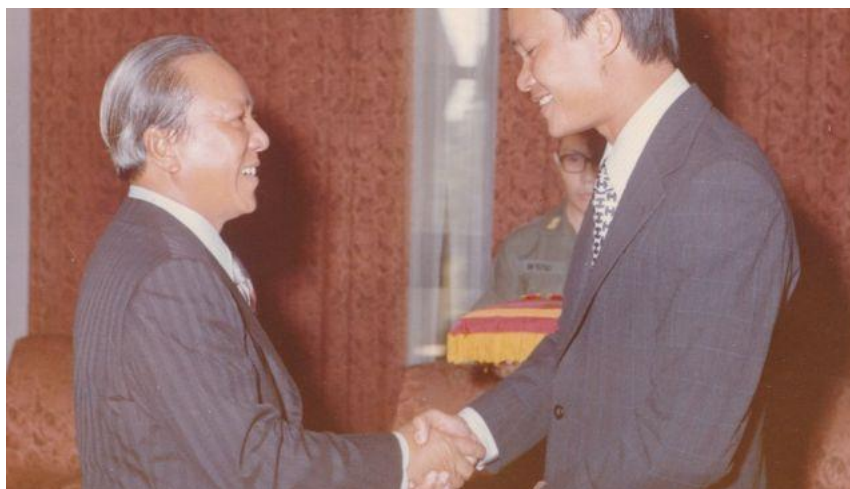
TT Thiệu trong một lần trao tặng huân chương cho ông Hoàng Đức Nhã

Bỗng nhiên, ngay phía trước xe, trong bóng tối mù mờ, tôi thấy sếp Polgar đang chạy xuống phi đạo. Xe tôi suýt nữa đụng vào ông. Tôi thắng gấp và mọi người ở đằng sau bay về phía trước, đập vào lưng ghế của tôi. Ông Thiệu và tướng Timmes bị trượt khỏi ghế ngồi. Quang cảnh lúc ấy giống một khúc phim hài, nhưng đồng thời cũng rất khủng khiếp. Tôi xin lỗi, và xe nhích về phía trước.