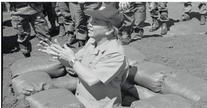
Tổng thống VNCH Nguyễn Văn Thiệu hồi tháng Hai 1975