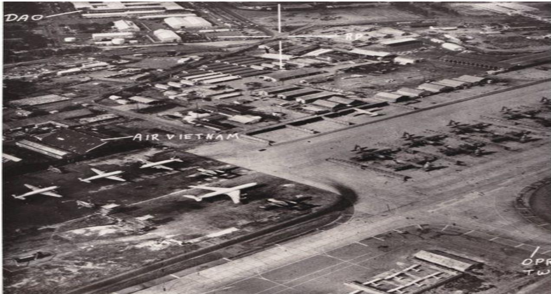
Phi trường Tân Sơn Nhất những ngày cuối cùng của VNCH

Bối cảnh xung quanh việc đưa ông Thiệu ra khỏi VN đã diễn ra như thế nào, thưa ông?