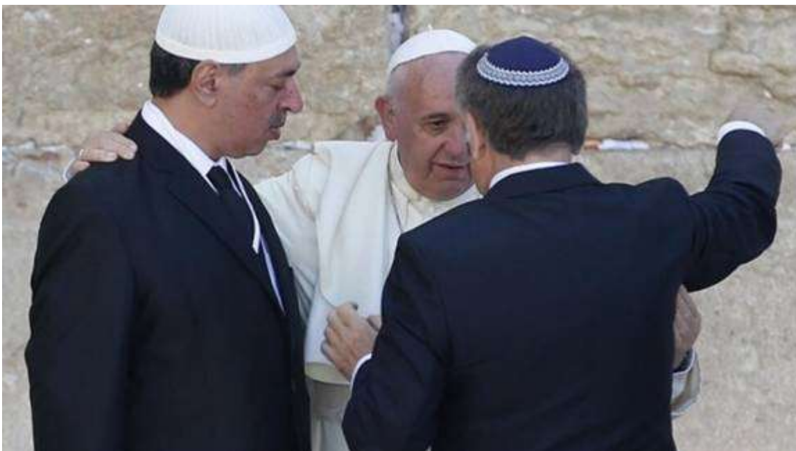
(hình chụp Đức Phanxicô và hai Thủ Lãnh Do Thái Giáo)