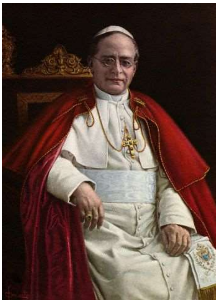
Đức Giáo Hoàng Piô XI (1922-1939)

Nguồn: http://catechesis.net/version1/index.php/van-kien-giao-hoi/duc-giao-hoang/thong-diep/445-thong-diep-aquadragesio-anno-tu-thap-nien-cua-dgh-pi-o-xi-ngay-15-5-1931