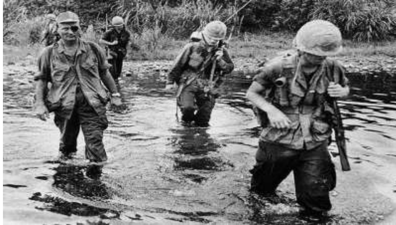
Israeli General Moshe Dayan on Patrol with US Marines – South Vietnam 1966