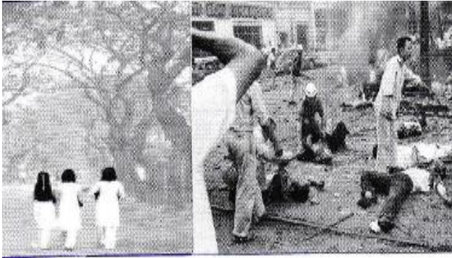
Các cháu học trò ngây thơ, vô tội bị đảng Việt cộng vô nhân giải phóng năm chết la liệt trên sân trường.

Khi gài mìn để phút sau bỗng thấy Xác người tung và máu đổ chan hòa Máu của ai?, máu của bà con ta Máu của người như con như mẹ Đêm hôm ấy mắt con tràn lệ Ác mộng về, con trăn trọc thâu canh!