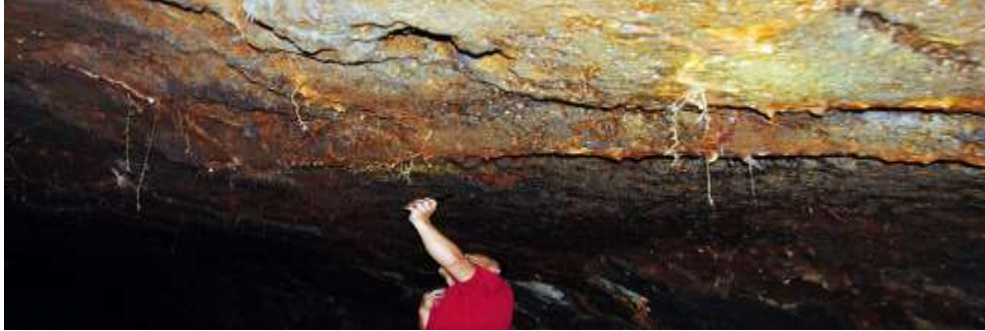
Thạch nhũ trên nền hang động tạo thành những hình thù sinh động.