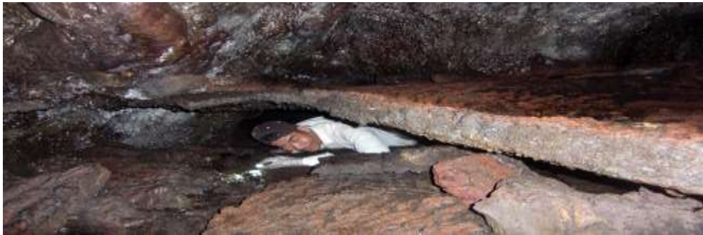
Hang này nối liền với hang khác qua ngách ngăn chỉ một người chui lọt.