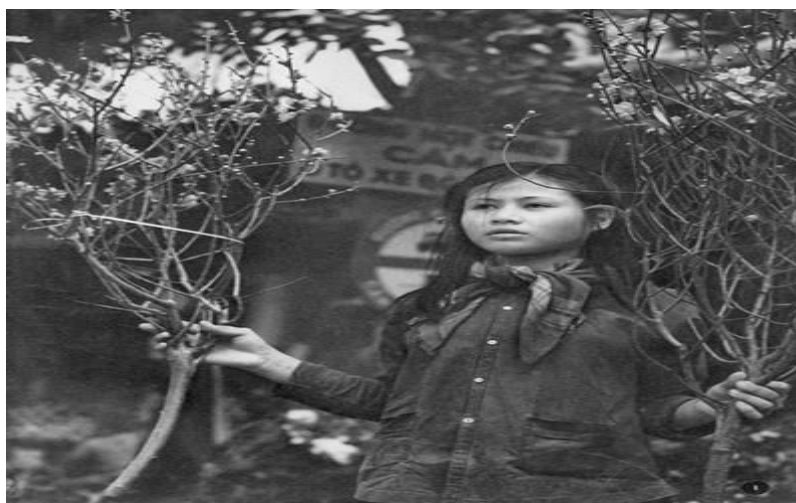
Thiếu nữ cầm những cành đào ở Hà Nội ngày giáp Tết.