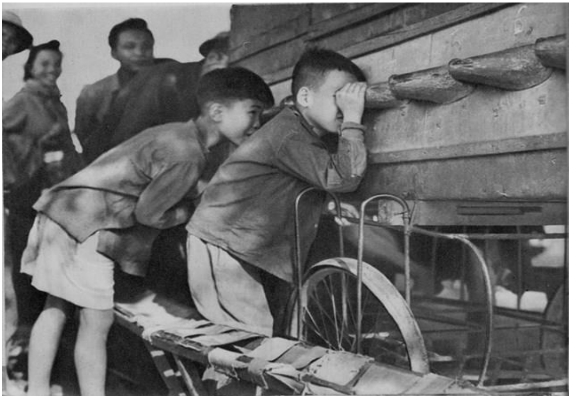
Các cậu bé xem phim thùng lưu động trên phố.