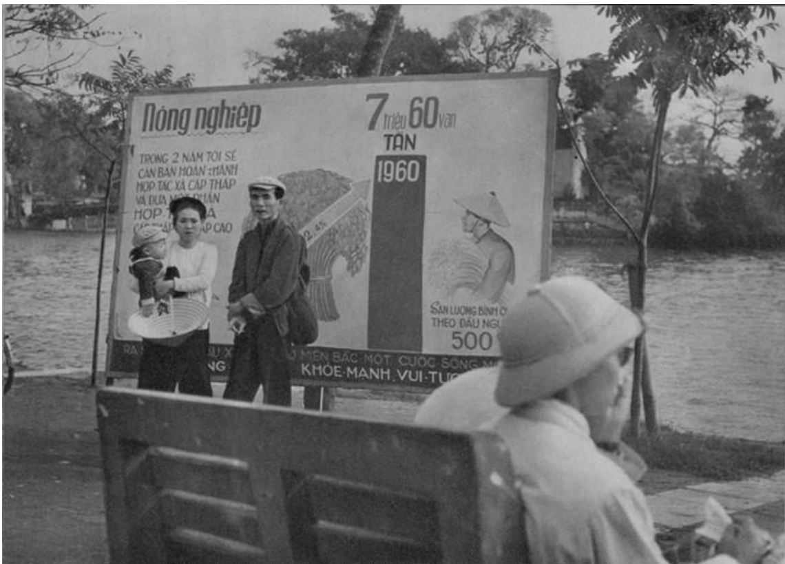
Áp-phích cổ động phát triển nông nghiệp ở bờ hồ Gươm.