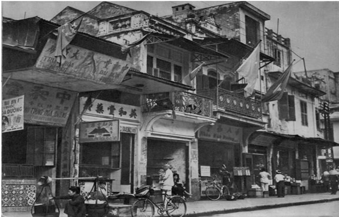
Phố Hàng Buồm, khu phố của người Hoa ở Hà Nội xưa.