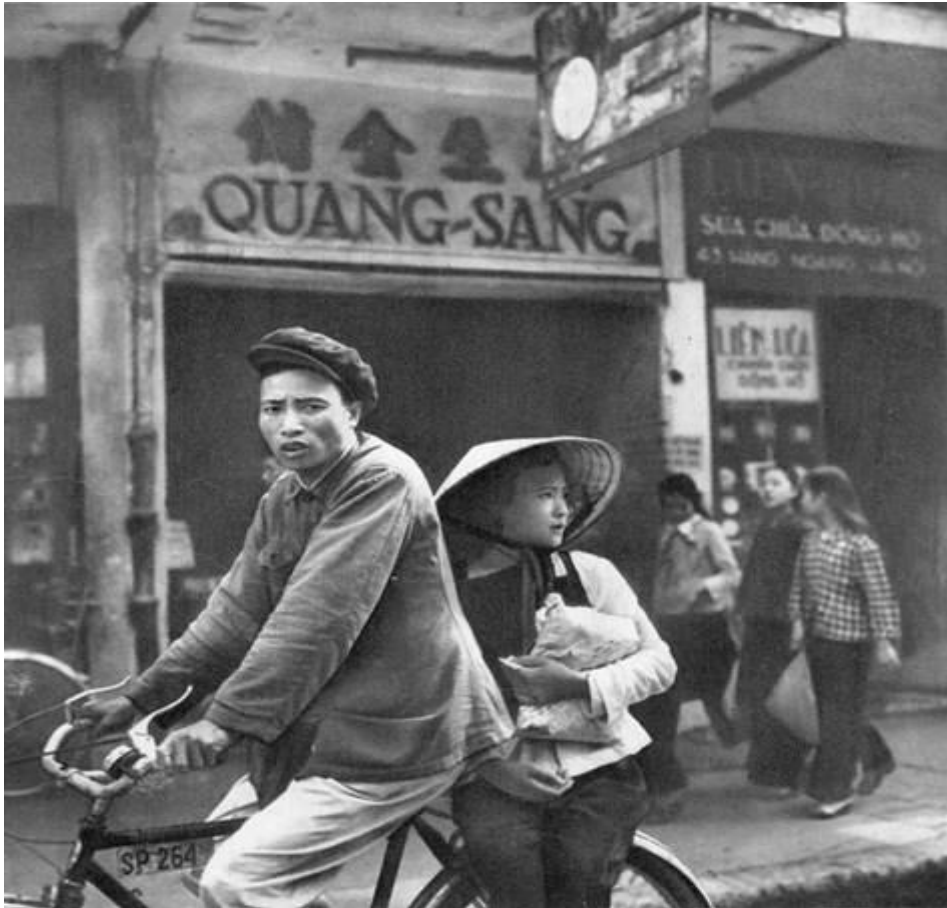
Trên phố Hàng Ngang.