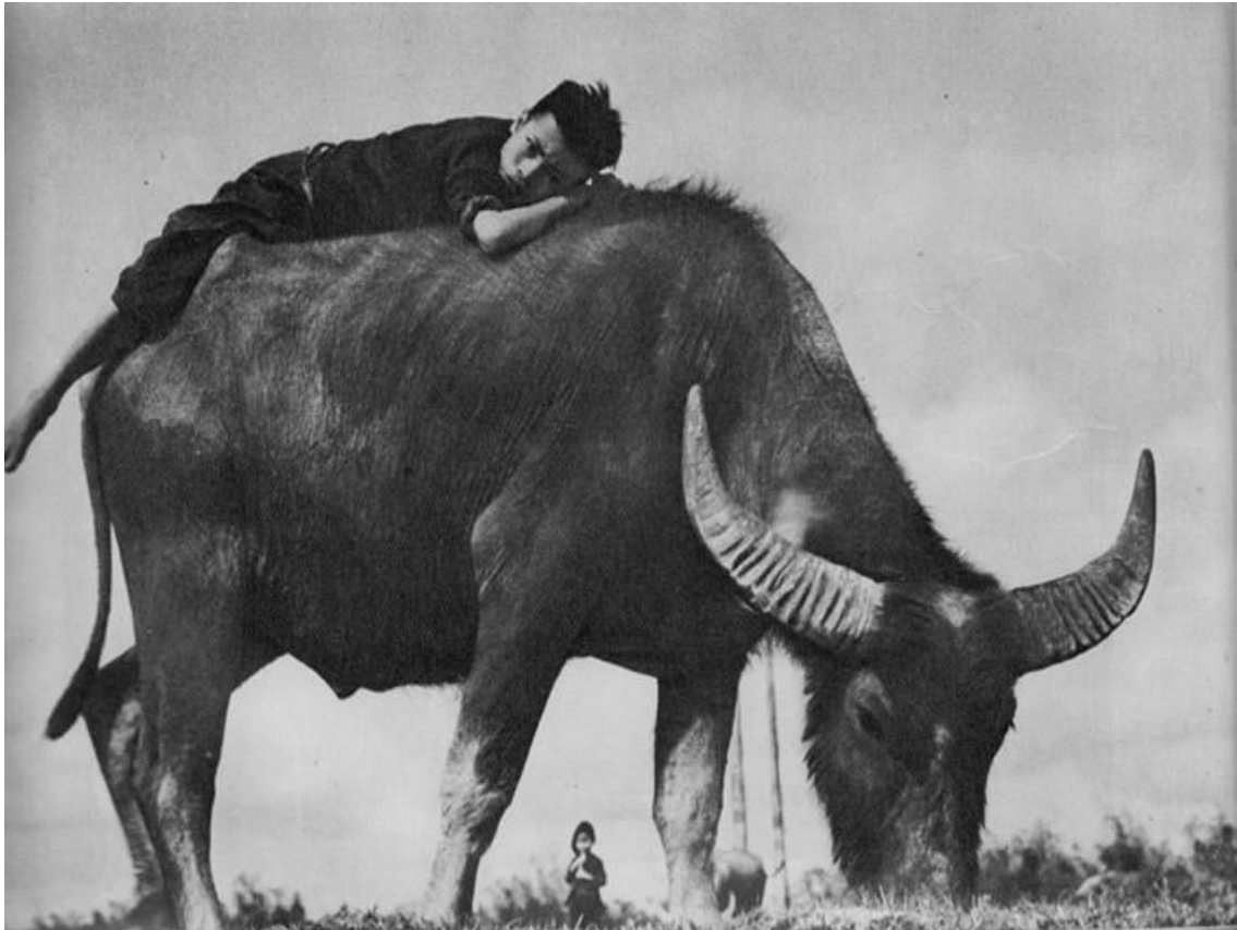
Em bé chăn trâu ở miền quê Bắc Bộ.