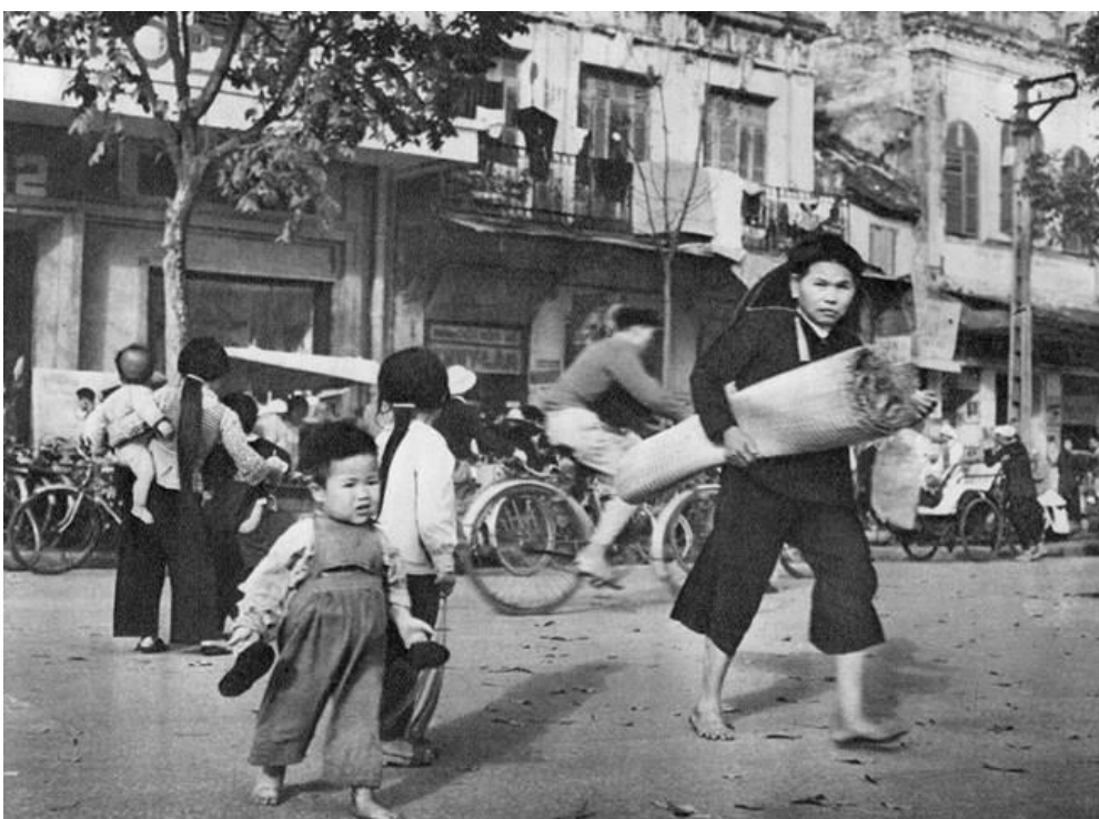
Phương tiện giao thông trên đường phố Hà Nội thập niên 1950 chủ yếu là xe đạp và xích lô.