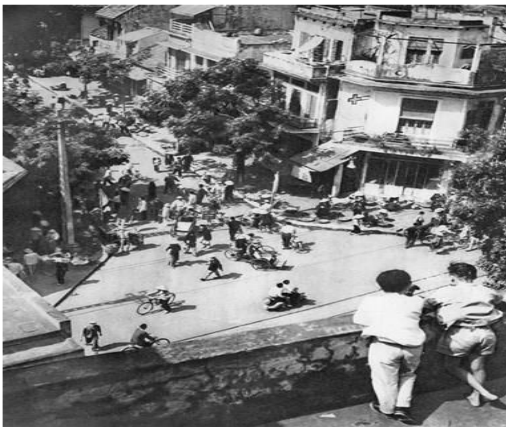
Một góc phố cổ Hà Nội.