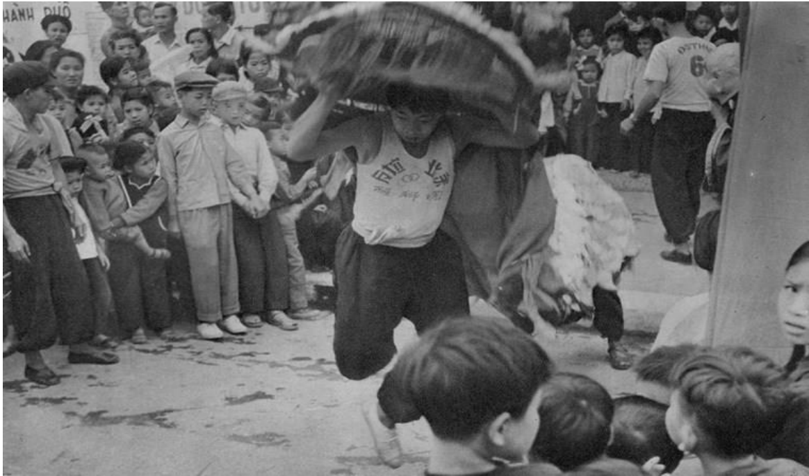
Người Hoa ở khu phố cổ Hà Nội múa lân mừng năm mới.