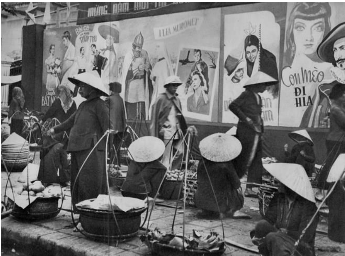
Những tấm áp-phích bên ngoài một rạp phim.