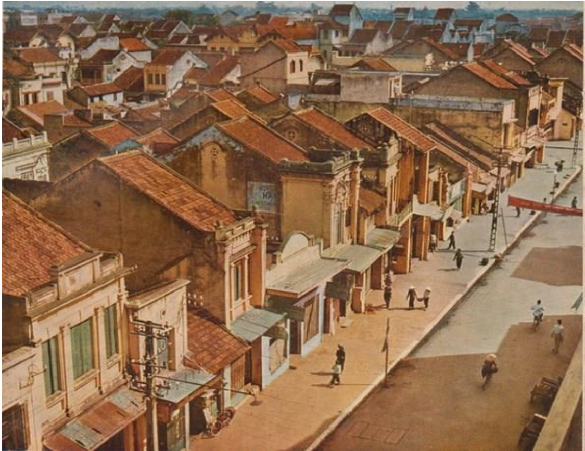
Một góc nhìn tuyệt đẹp về khu phố cổ Hà Nội thập niên 1950.