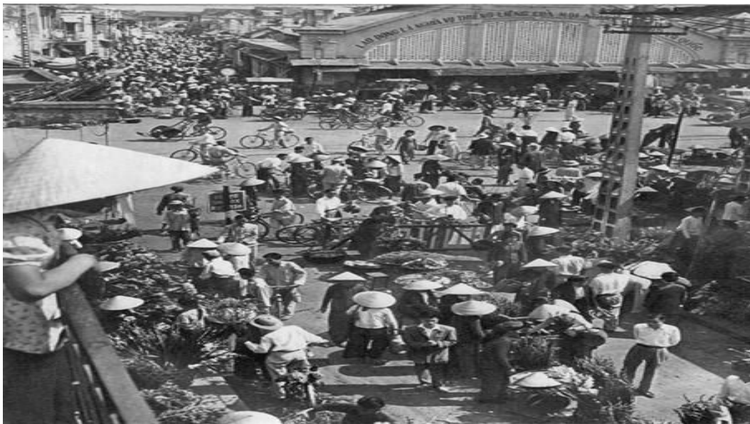
★Cảnh tượng nhộn nhịp tại khu vực chợ Đồng Xuân.

Hình ảnh được scan và giới thiệu trên tài khoản Facebook của thành viên nick Binh Dang.