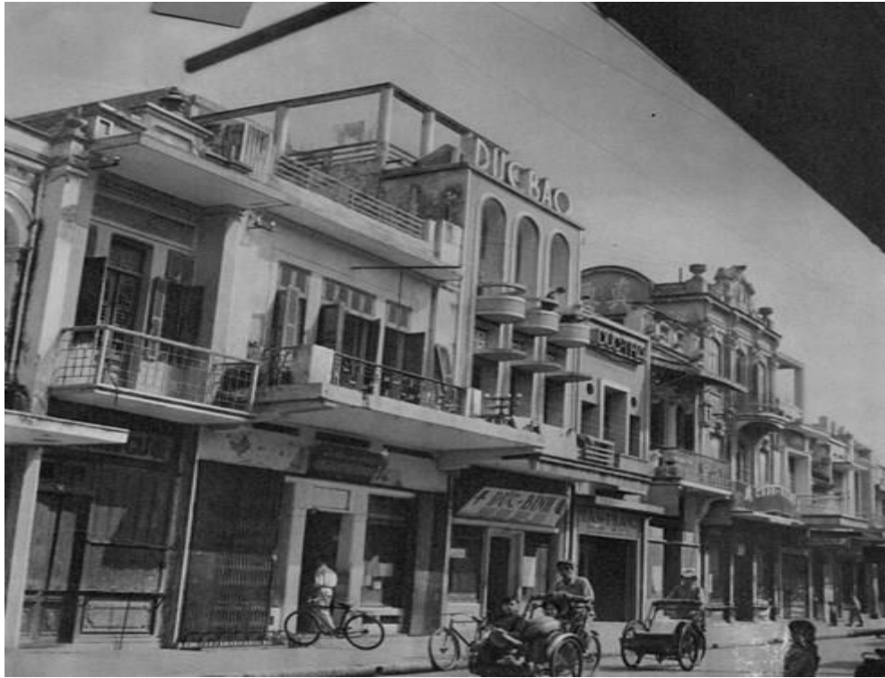
Phố Hàng Bạc.