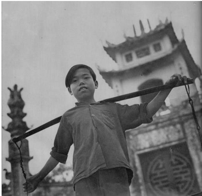
Chú bé bán rong trước cổng một ngôi chùa.