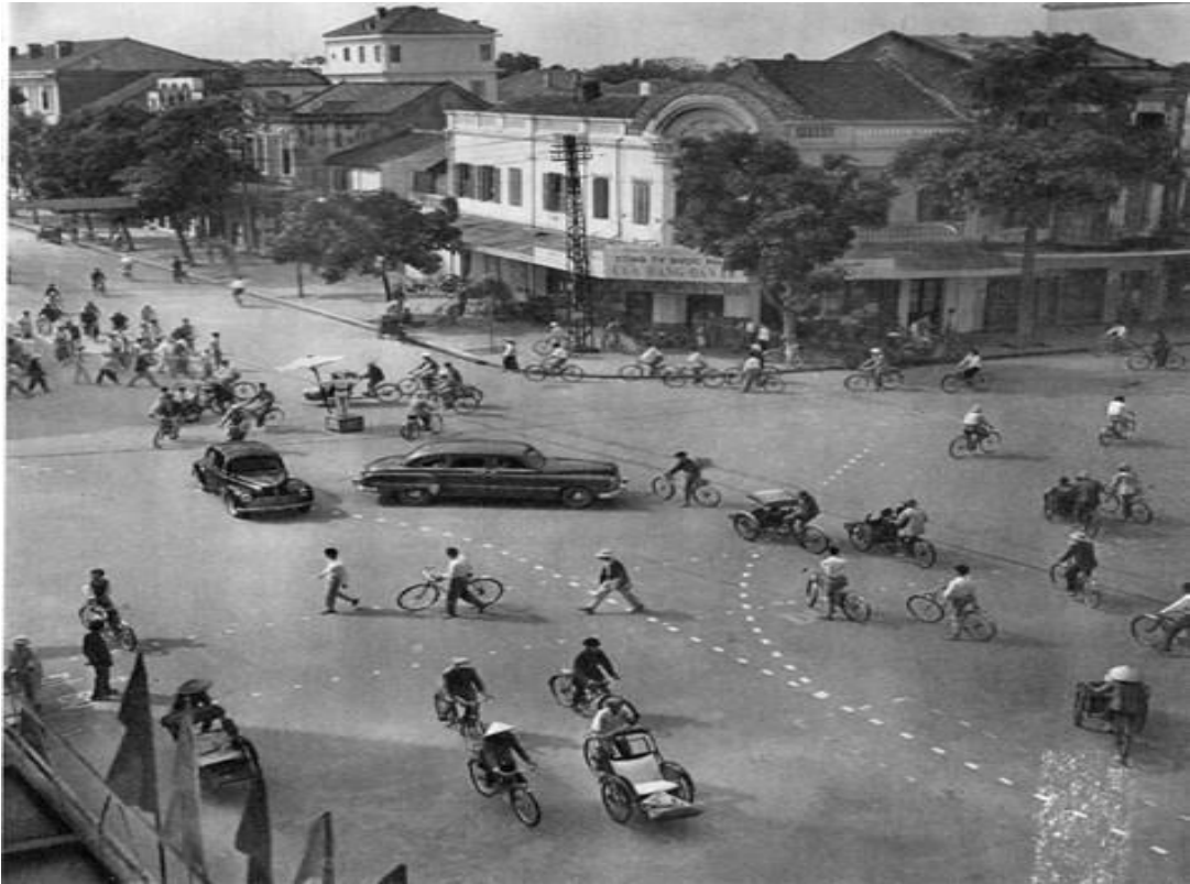
Ngã tư Tràng Tiền - Hàng Bài bên bờ hồ Gươm.