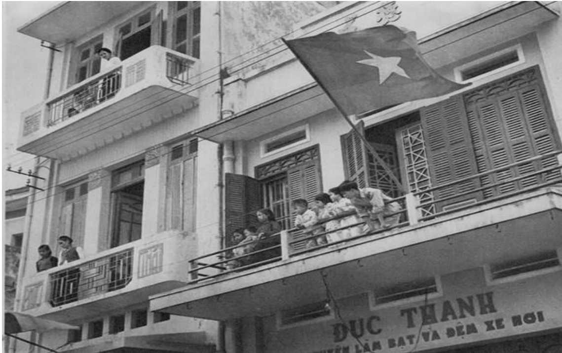
Trên ban công các tòa nhà mặt tiền phố Hàng Bạc.