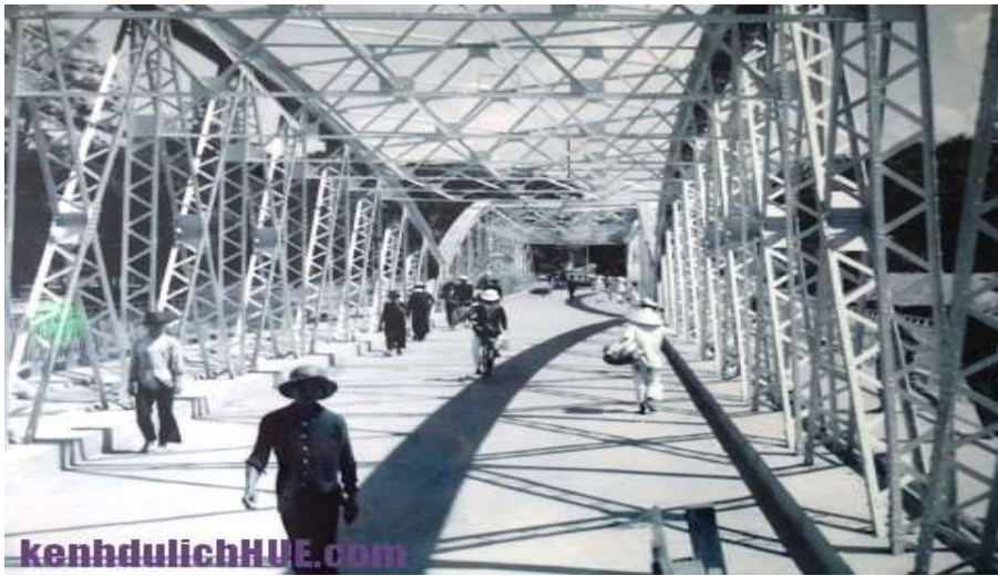
Cầu Trường Tiền