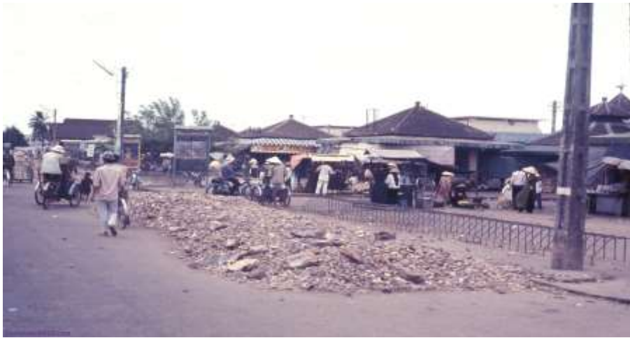
Một góc chợ