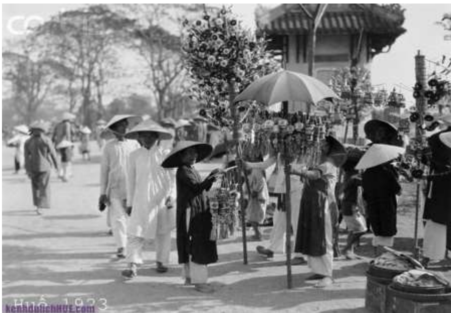
Buôn bán ven đường 1923