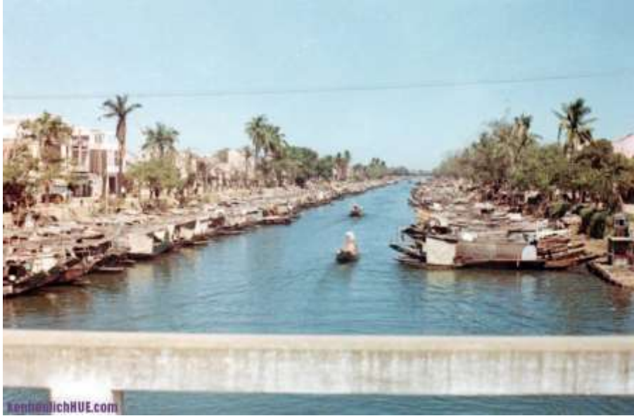
Sông Đông Ba nhìn từ đường Huỳnh Thúc Kháng