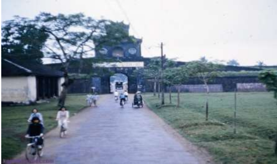
Cửa Thượng Tứ 1965