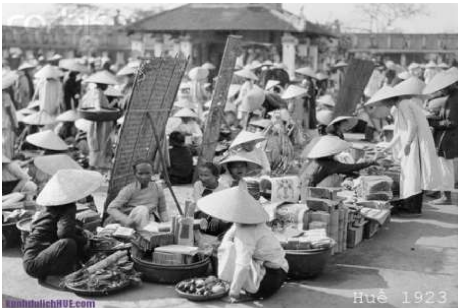
Chợ Đông Ba năm 1923