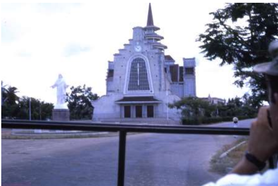
Nhà dòng cứu thế