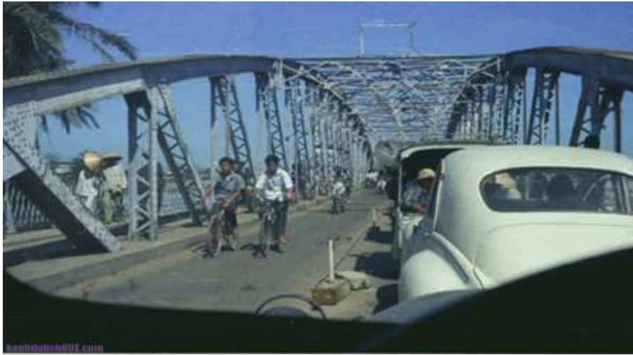
Cầu Trường Tiền