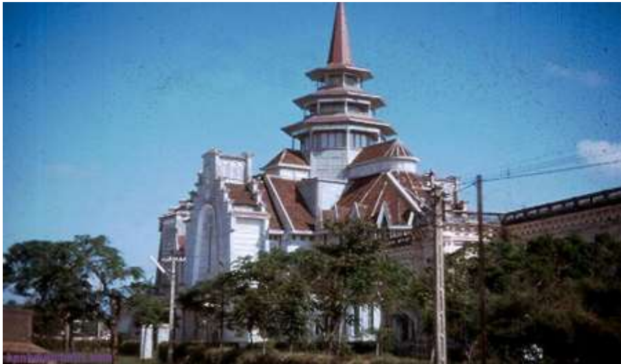
Nhà dòng cứu thế