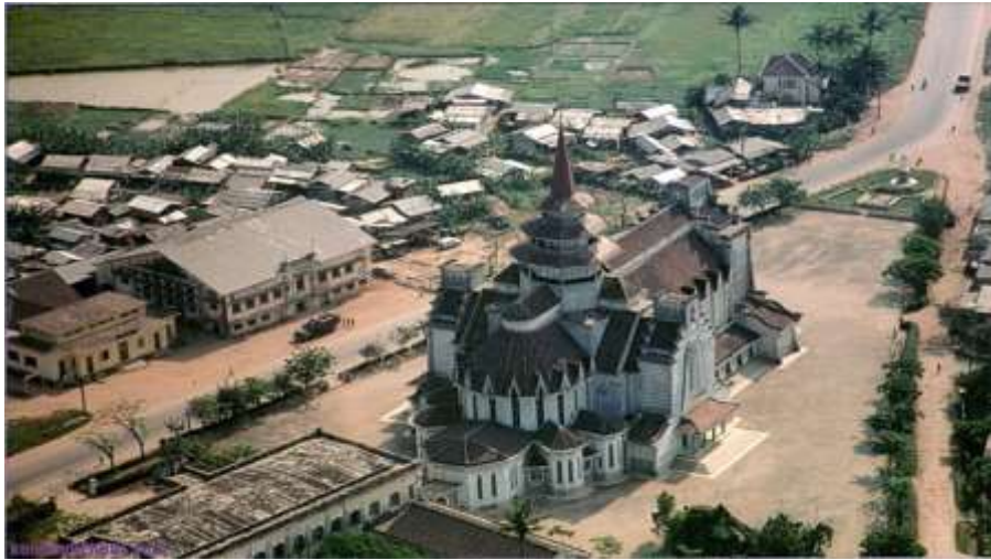
Nhà dòng cứu thế