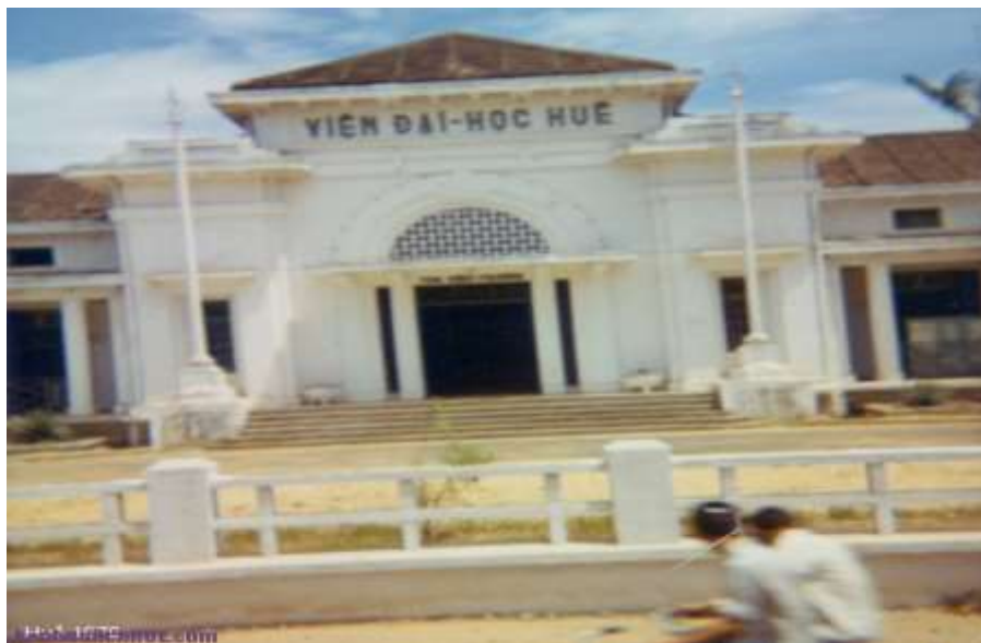
Đại học Huế xưa