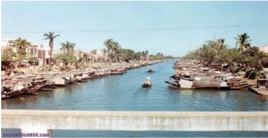
Sông Đông Ba nhìn từ cầu Gia Hội