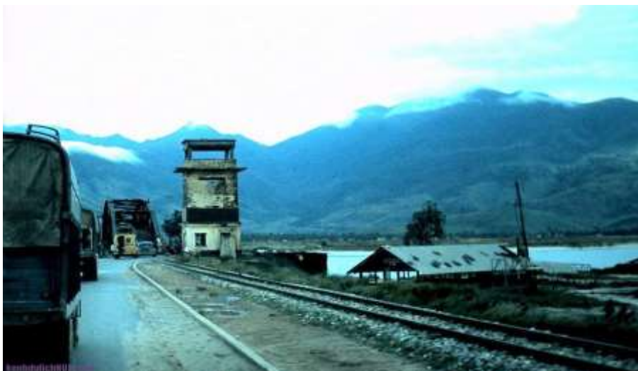
Cầu Trườn 1960