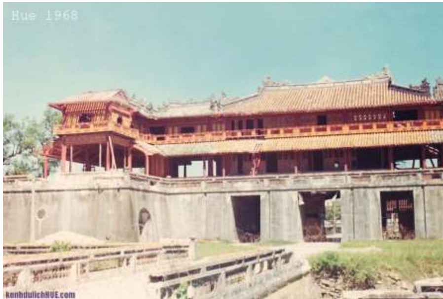
Ngọ Môn năm 1968