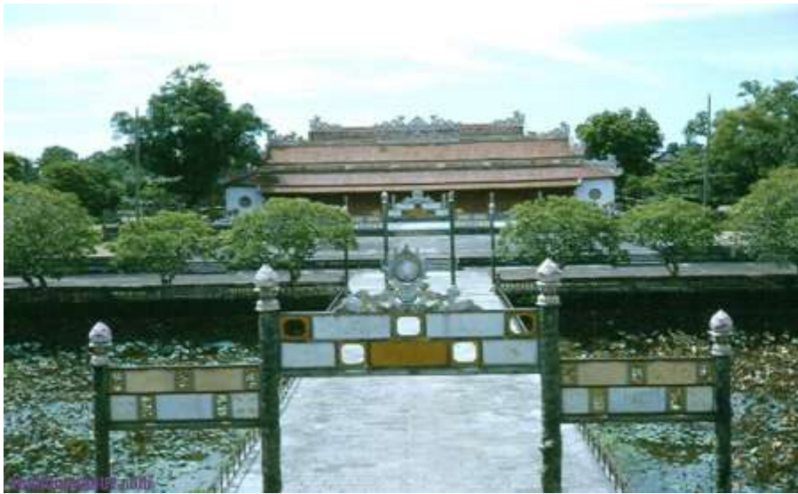
Điện Thái Hòa năm 1964