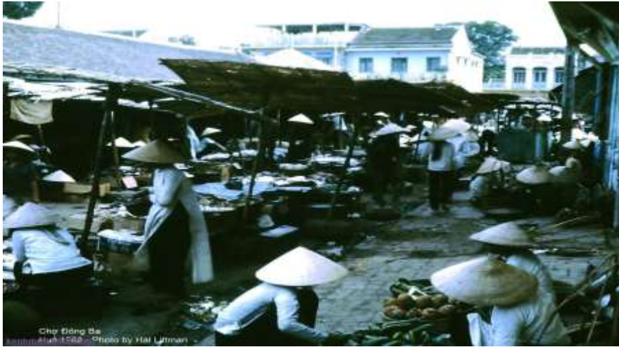
Chợ Đông Ba