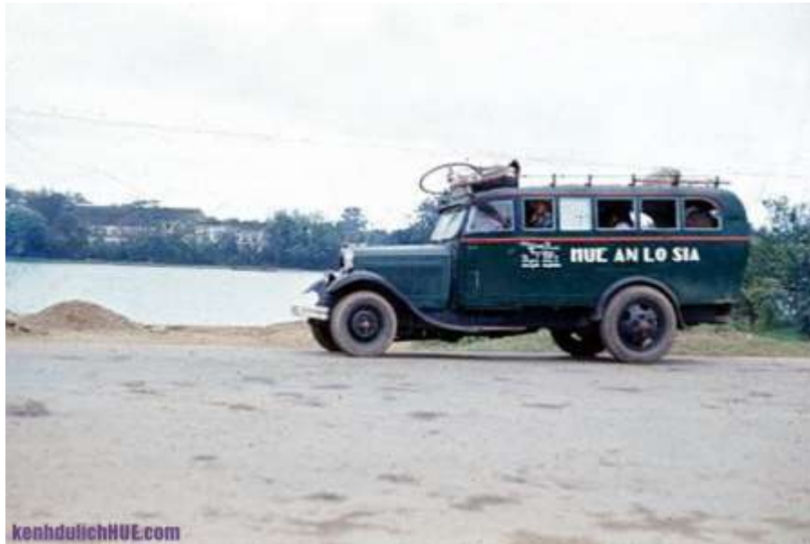
Xe đồ xưa

Những hình ảnh được sưu tầm từ nhiều nguồn trên mạng, đây là những hình Huế thời chiến tranh và trước đó. Có những hình ảnh cho ta thấy vị trí đó đã thay đổi nhiều theo thời gian nhưng cũng có những hình ảnh mà bây giờ vẫn thế.