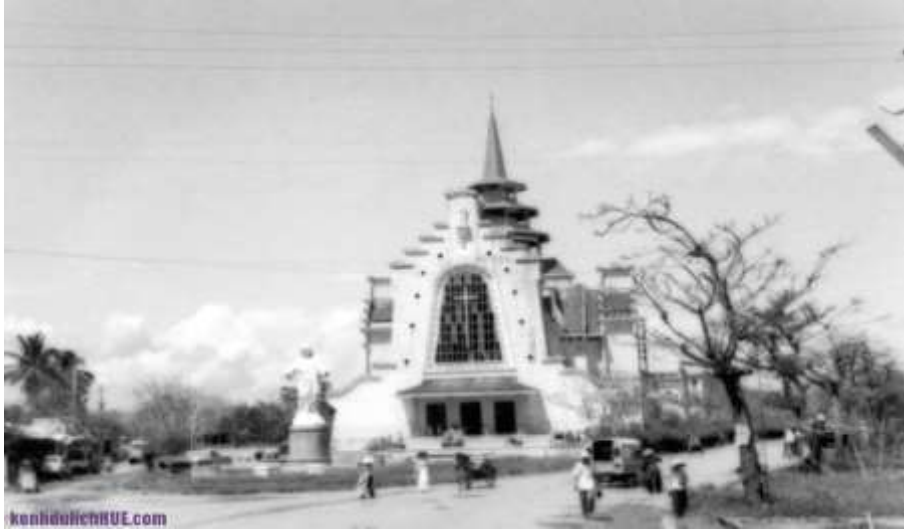
Nhà dòng cứu thế