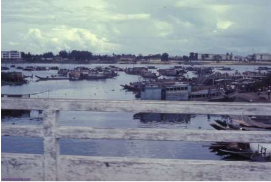
Bờ Nam nhìn từ cầu Gia Hội