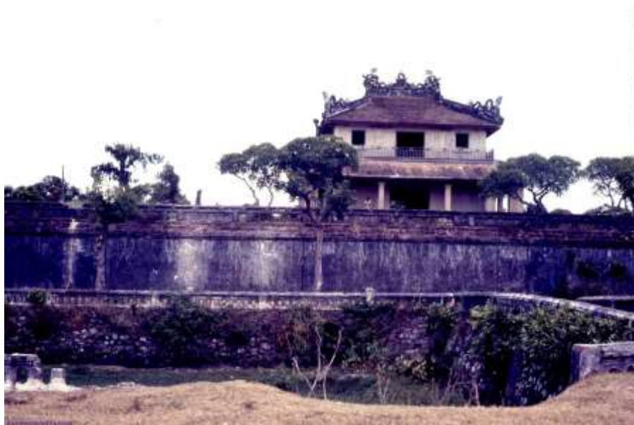
Lầu Tứ Phương Vô Sự 1966