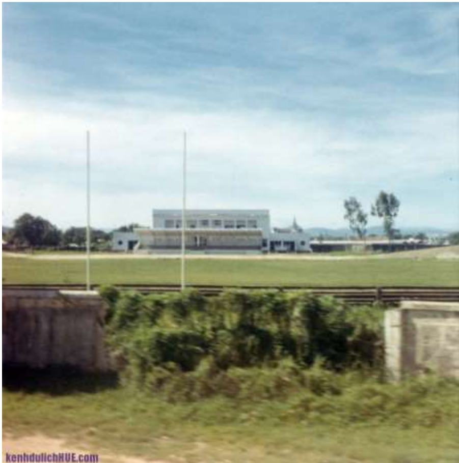
Sân vận động Tự Do xưa