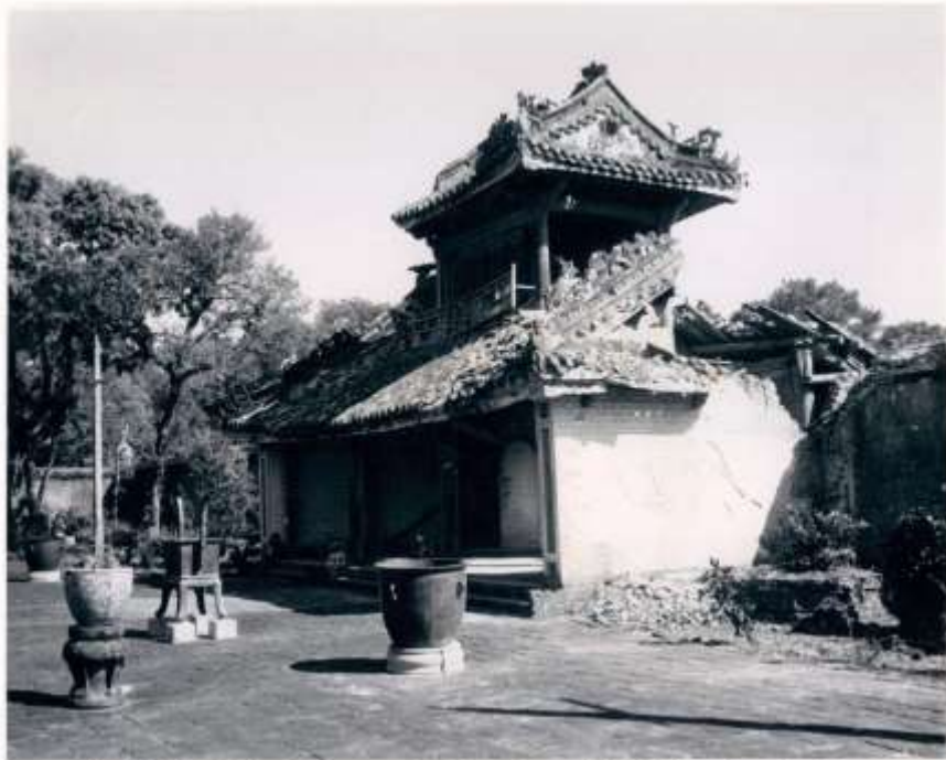
Bia Lăng Tự Đức

Hue 1968 - Tomb Of Emperor Tu Duc, Damaged By Helicopter Rockets