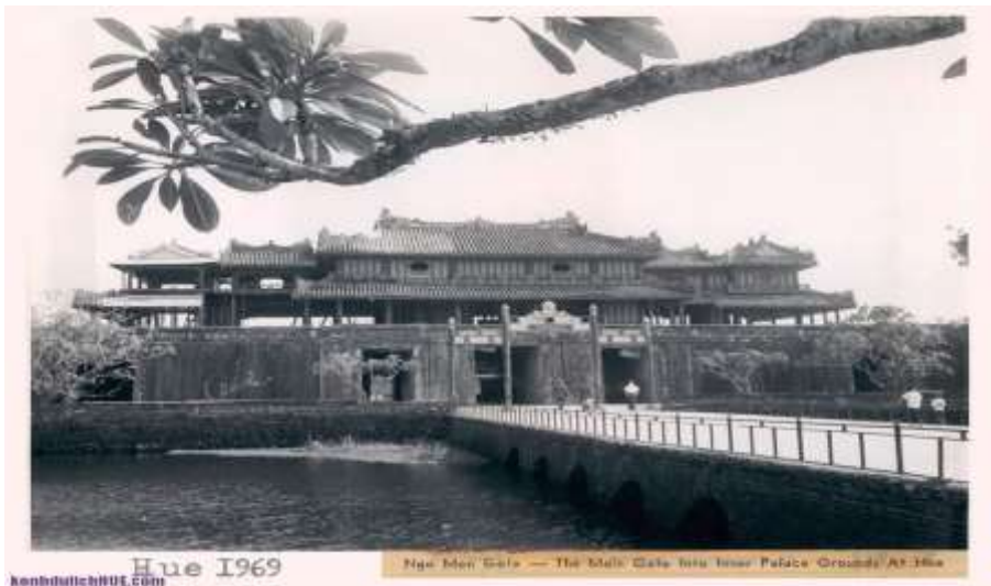
Ngọ Môn năm 1969