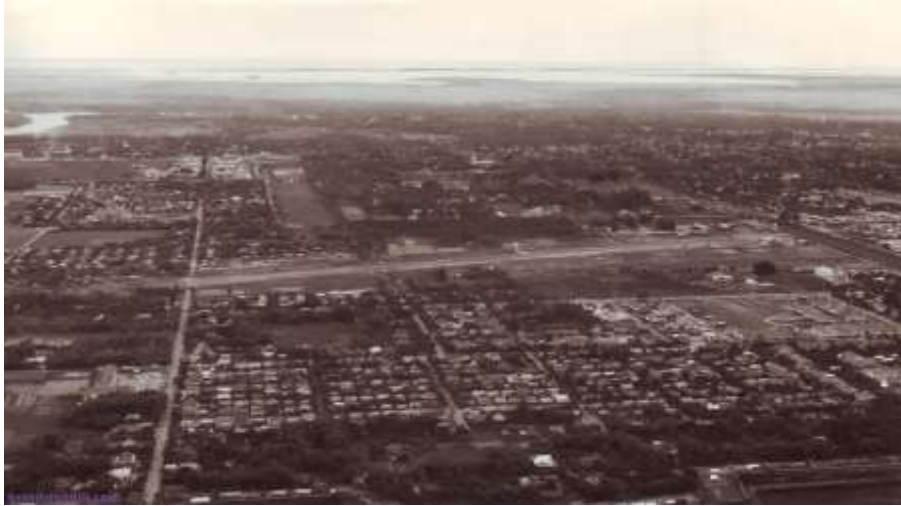
Sân bay Tây Lộc xưa