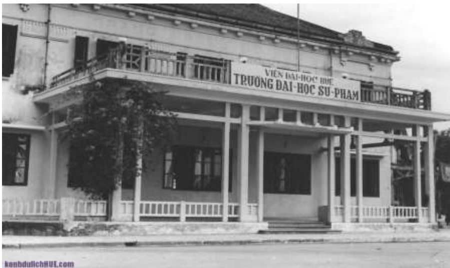
Đại Học Sư Phạm xưa