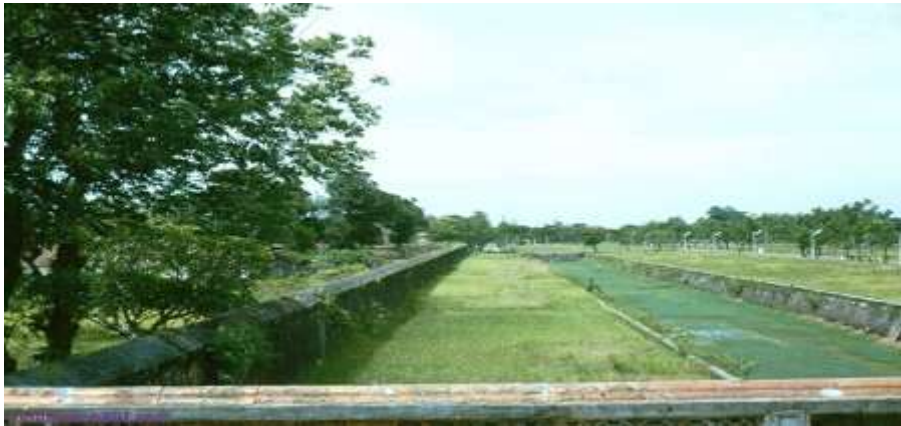
Góc kinh thành Huế 1964