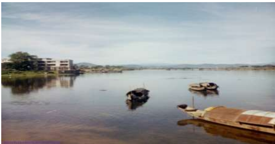
Khách sạn Hương Giang và Cầu Trường Tiền nhìn từ đập đá