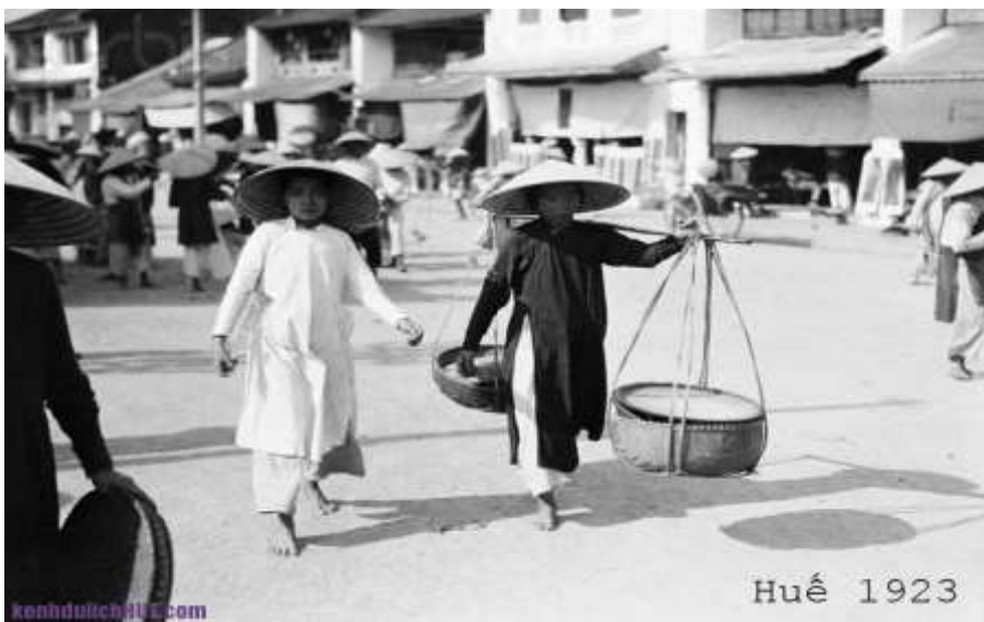
Chợ Huế 1923