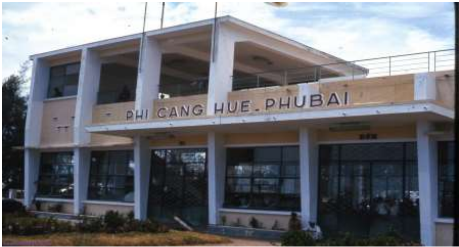
Sân bay Phú Bài xưa