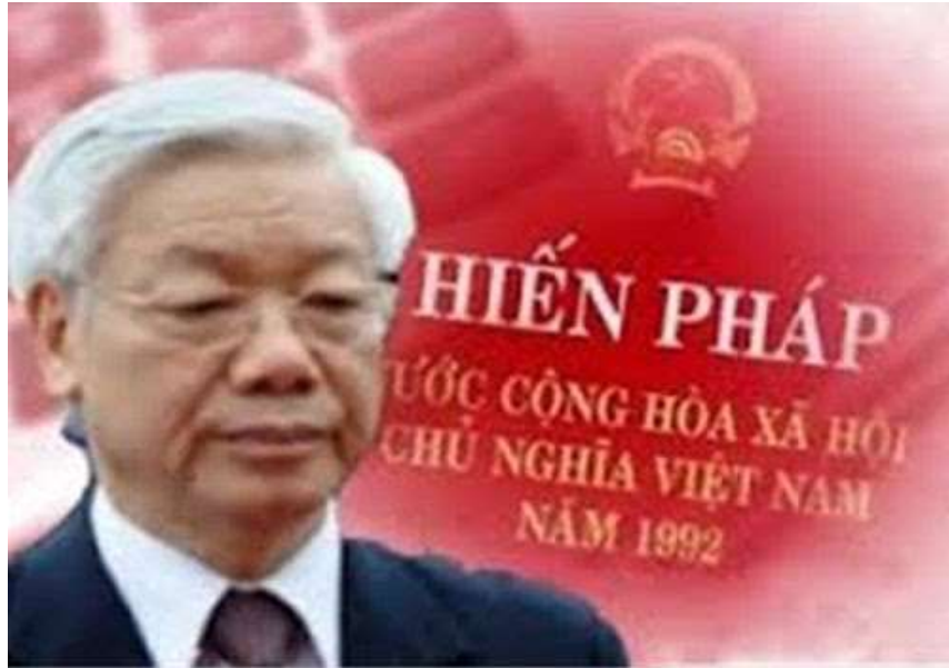
CHXHCNVN (Chẳng Hề Xấu Hồ Chút Nào Vì Ngu)

Chúng tôi, người dân VN yêu chuộng tự do và hòa bình cũng mong được đứng bên cạnh các bạn năm châu để tồn tại và góp bàn tay nhỏ bé kiến tạo tòa nhà chung nhân loại trường tồn và phát triển trong tự do và tình nhân ái yêu thương.