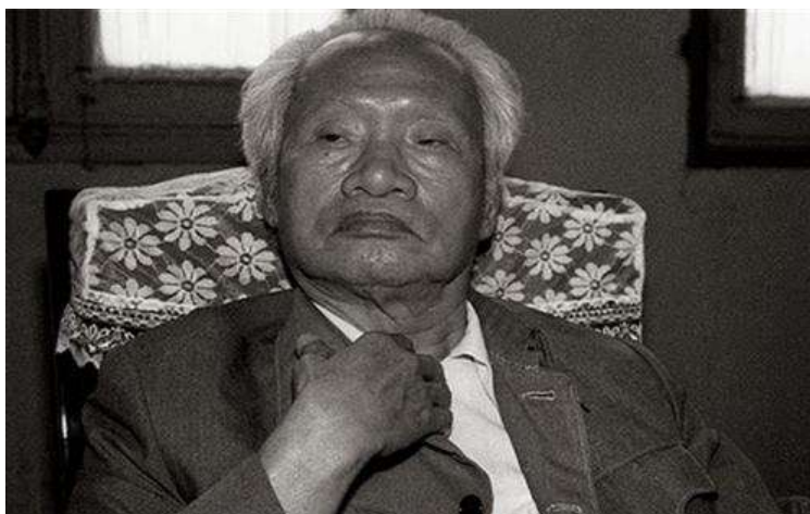
Thủ tướng CS Phạm Văn Đồng

Có lần chúng tôi đi xem một phiên tòa xử một người mua xe gian, xe ăn cắp. Chánh án sau khi xem xét các chứng cứ về tang vật và giấy tờ chứng minh, thì tuyên án bỏ tù người bán vì đã ăn cắp của người khác, còn người mua thì bị trả lại xe cho chủ, và mất luôn tiền vì kẻ bán đã sài hết tiền, không hoàn được.