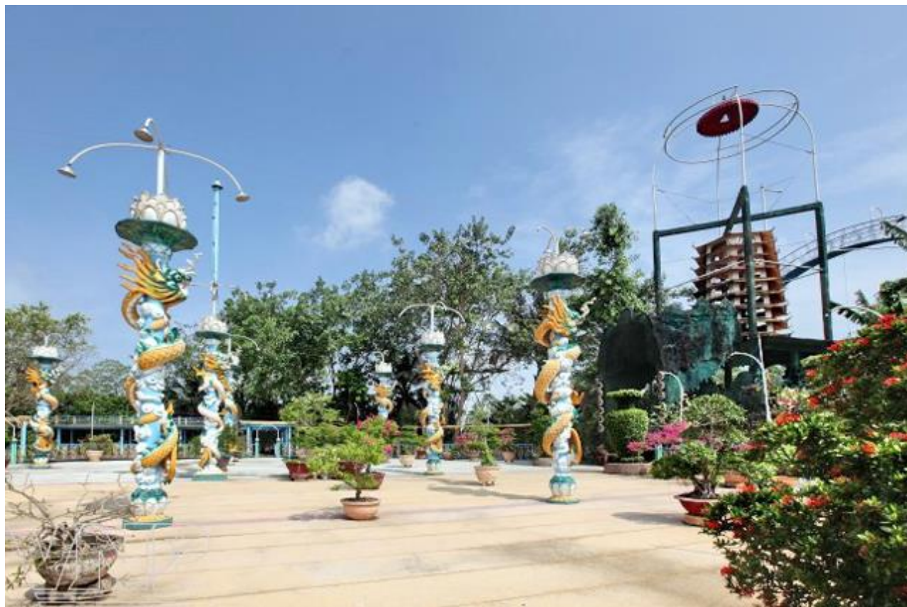
Sân rồng trong khu di tích Đạo Dừa tại Cồn Phụng

Trong các hành trình Tour du lịch miền Tây hoặc Tour du lịch Bến Tre , hầu như đều không thể thiếu vắng điểm đến là khú di tích Đạo Dừa tại Cồn Phụng . Khu di tích này là nơi thể hiện nét đẹp văn hóa và tín ngưỡng của người dân vùng đất được xem là xứ sở của cây dừa. Khu di tích Đạo Dừa hay còn gọi là “Nam Quốc Phật” của ông Đạo Dừa tại Cồn Phụng hiện vẫn còn khá nguyên vẹn sau gần 50 năm xây dựng, trở thành một trong những điểm du lịch thu hút nhiều du khách ở tỉnh Bến Tre.