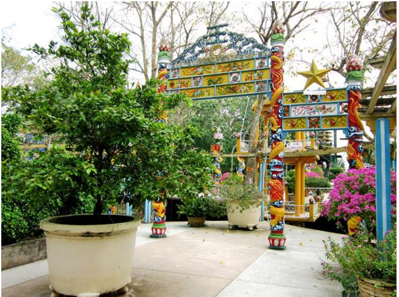
Cổng vào khu vực hành đạo của Đạo Dừa

Nói về Đạo Dừa, hẳn nhiều du khách không khỏi tò mò về nguồn gốc và cách thức hành đạo của tín ngưỡng này. Theo như tìm hiểu của Viet Fun Travel , Đạo Dừa là một tôn giáo do ông Nguyễn Thành Nam, một kỹ sư học từ Pháp về, tuy đã có gia đình nhưng sau quyết tâm ngồi thiền đi tu và lập ra Đạo Dừa tại cồn Phụng vào năm 1963. Chủ trương của Đạo Dừa là hòa đồng tôn giáo và ủng hộ hòa bình.