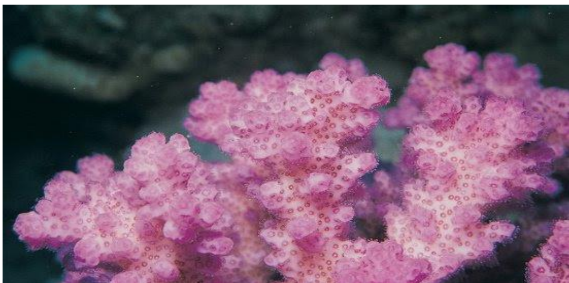
San hô cành sần sùi ( Pocillopora verrucosa ).