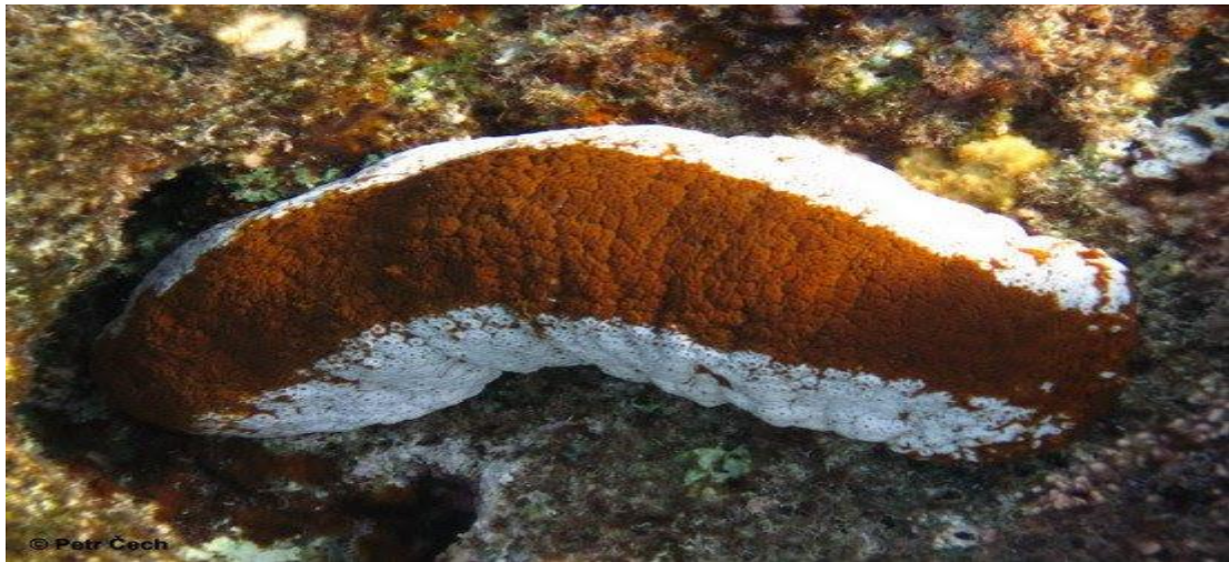
Đồn đột dừa ( Actinopyga mauritiana ).