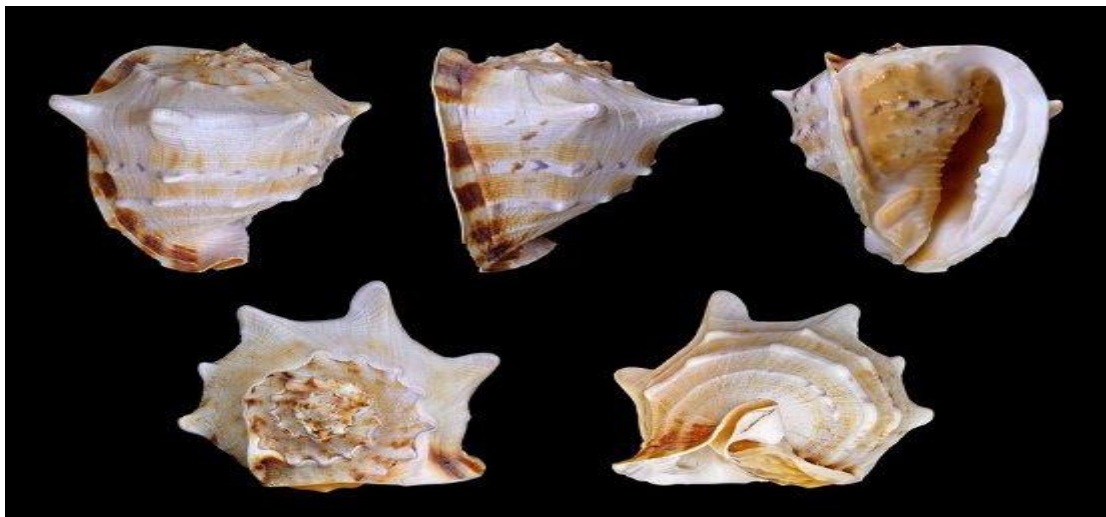
Ốc Kim khôi ( Cassis cornuta ).