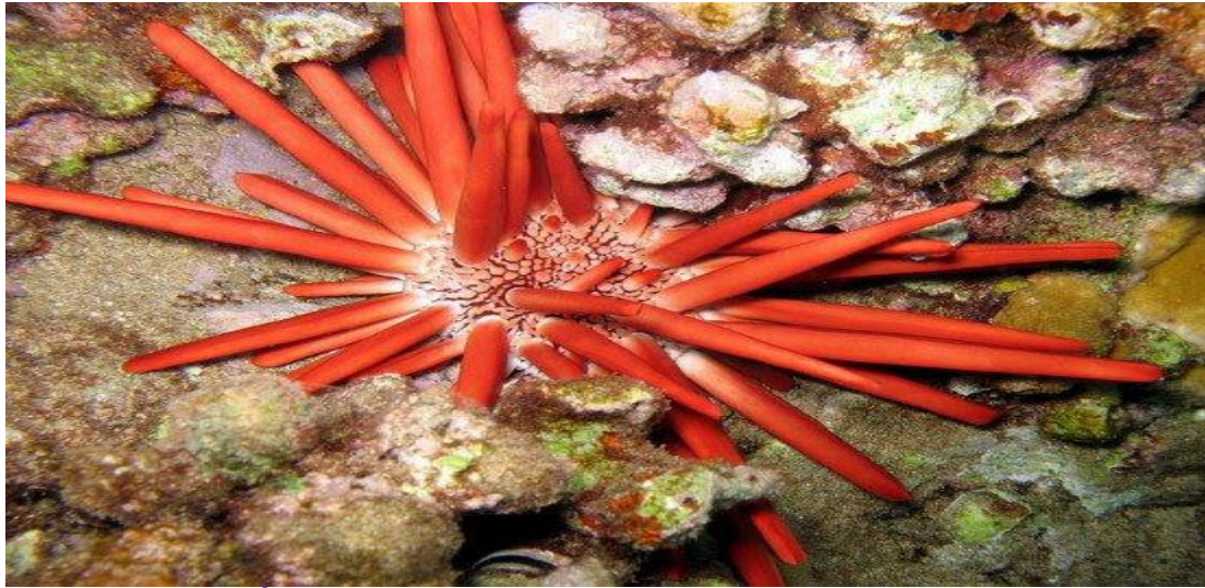
Câu gai đá ( Heterocentrotus mammillatus ).