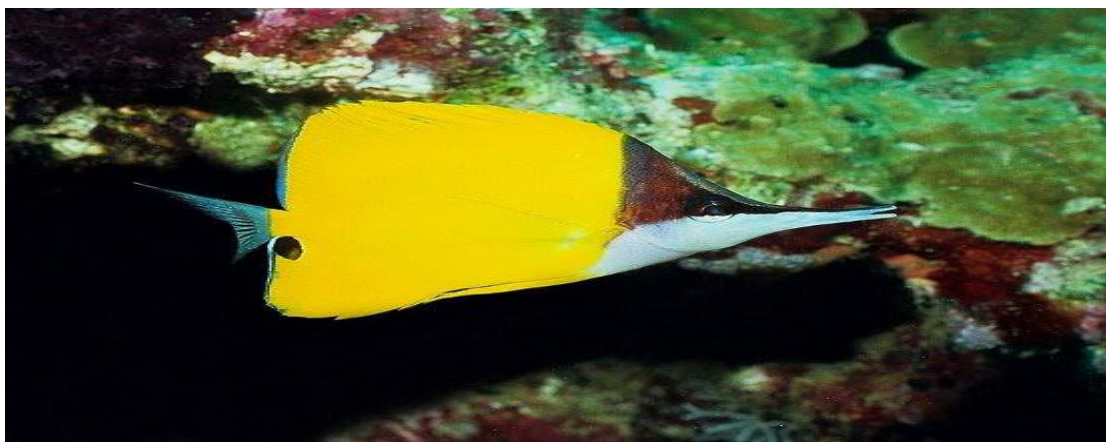
Cá Bướm mõm dài ( Forcipiger longirostris ).