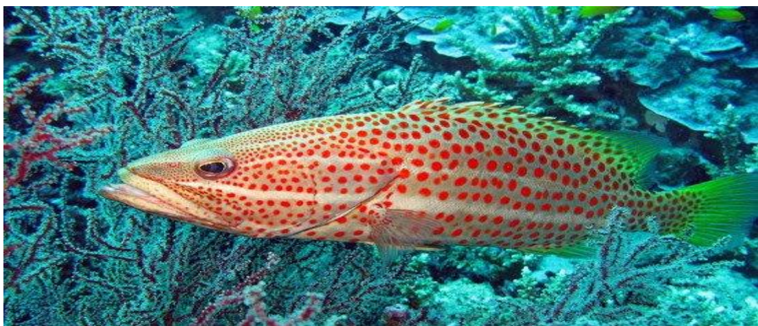
Cá Mú sọc trắng ( Anyperodon leucogrammicus ).