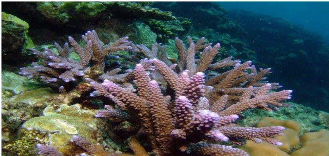
San hô lỗ đỉnh no-bi ( Acropora nobilis ).