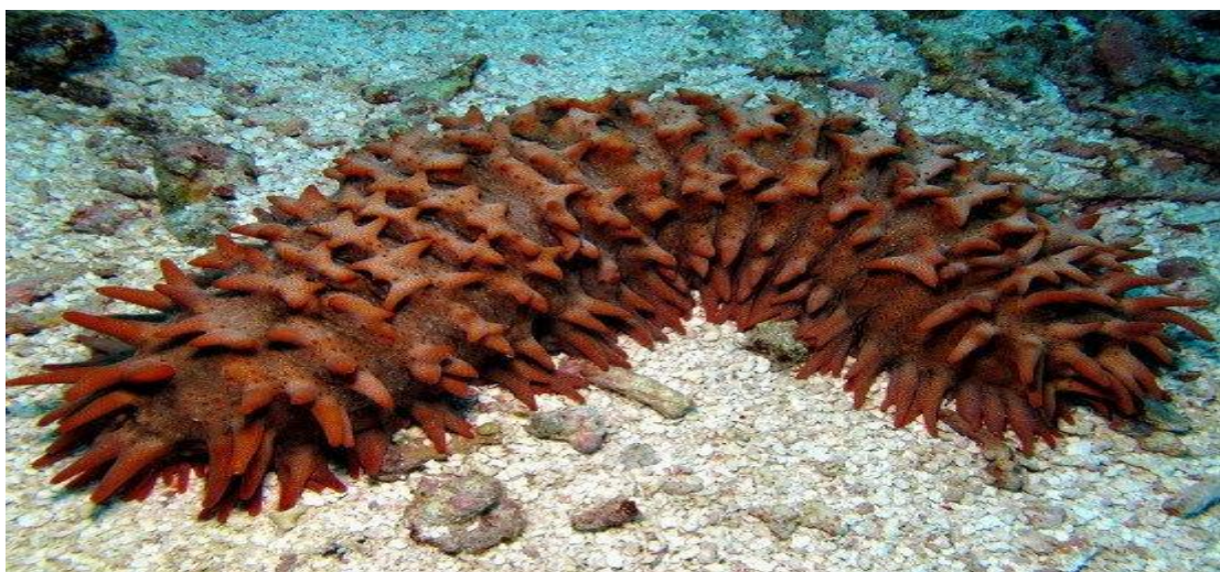
Đồn đột lựu ( Thelenota ananas ).