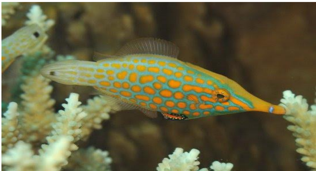
Cá Bò xanh hoa đỏ ( Oxymonacanthus longirostris ).