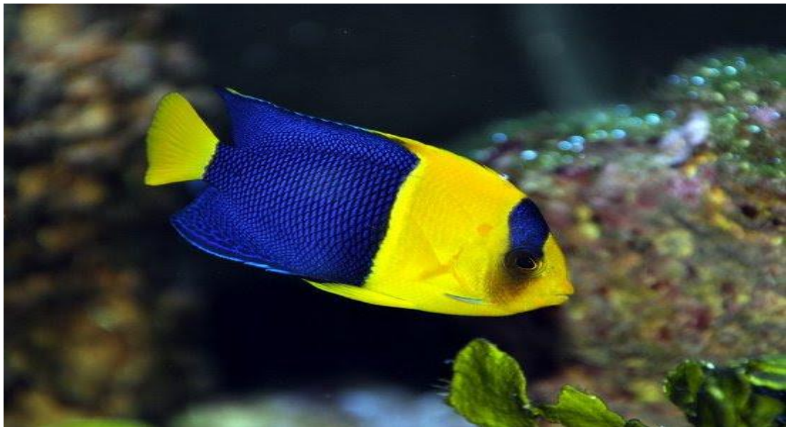
Cá Bướm hai màu ( Centropyge bicolor ).