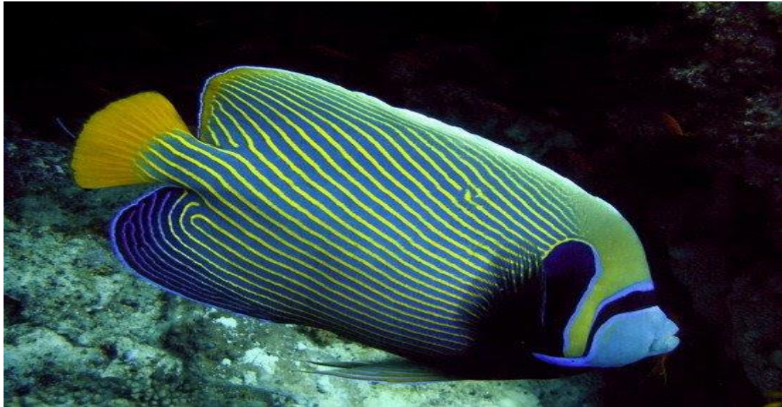
Cá Chim hoàng đế ( Pomacanthus imperator ).