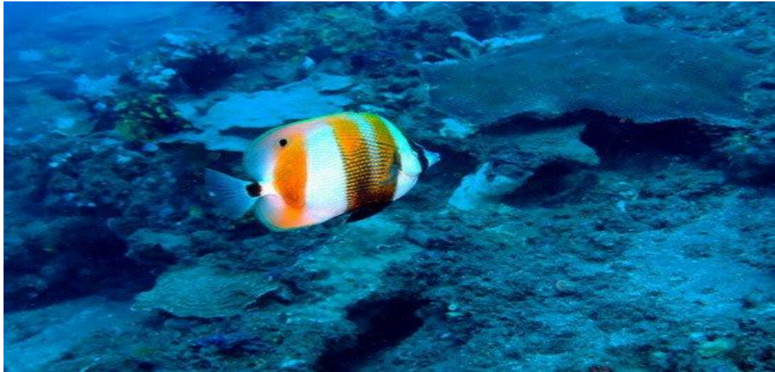
Cá Bướm bốn vằn ( Coradion chrysozonus ).