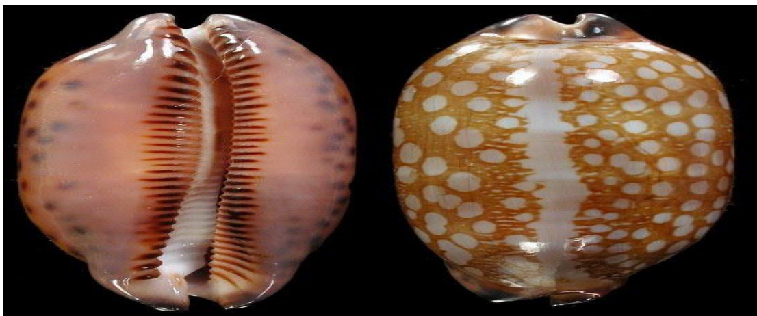
Ốc Sứ sọc trắng ( Mauritia scurra ).