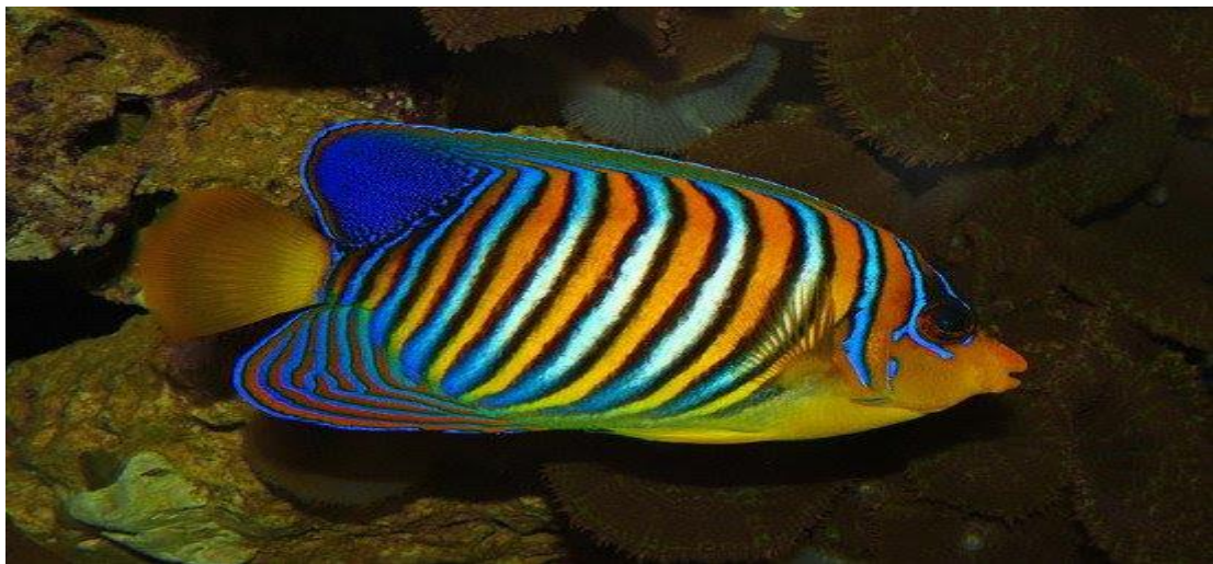
Cá Chim xanh nắp mang tròn ( Pygoplites diacanthus ).