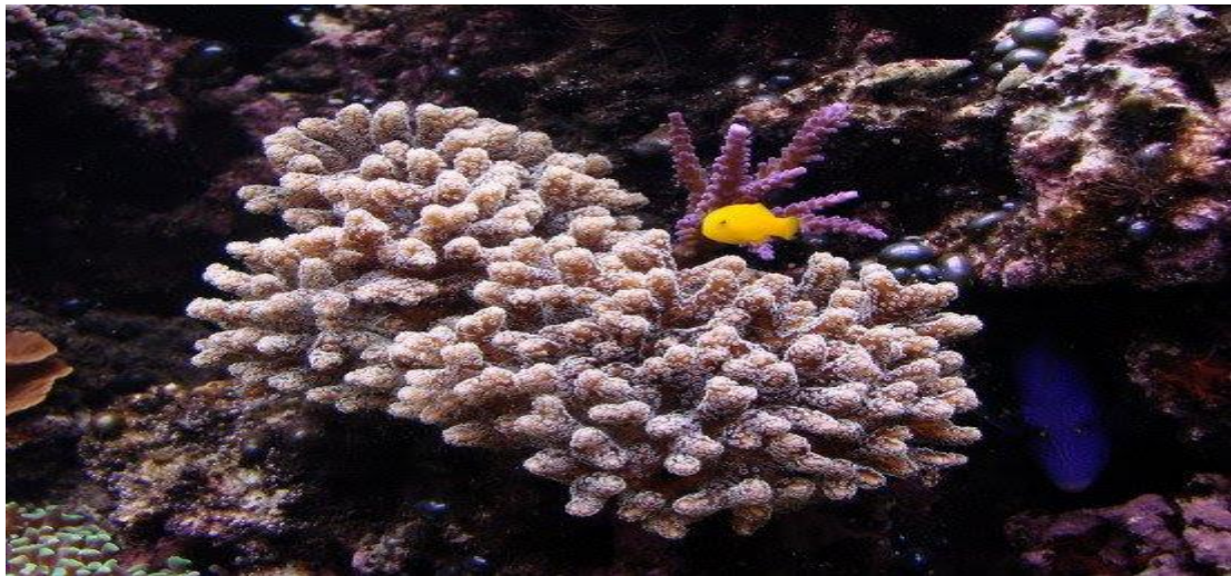
San hô cành đa mi ( Pocillopora damicornis ).