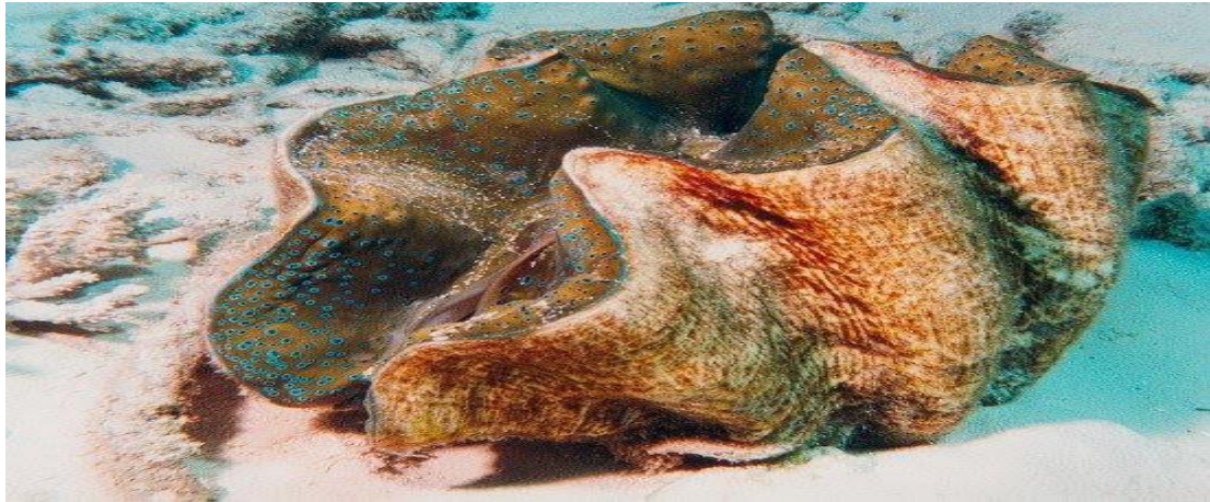
Trái tai nghe ( Hippopus hippopus )