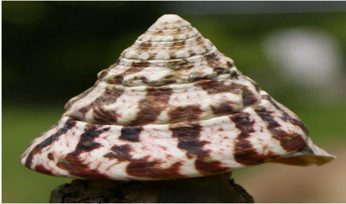
Ốc Đụn cái ( Trochus niloticus ).