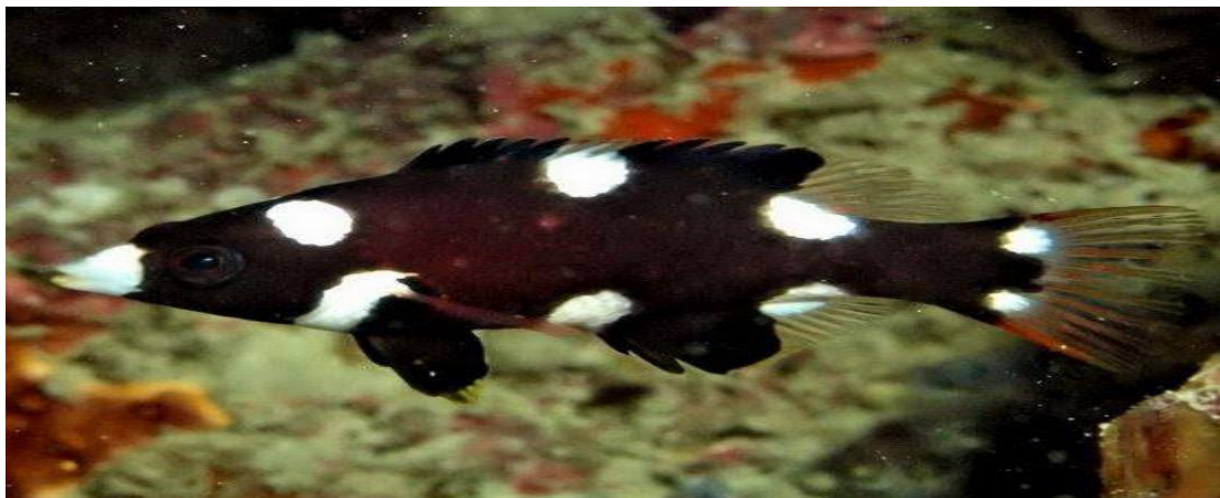
Cá Bằn chà axin ( Bodianus axillaris ).