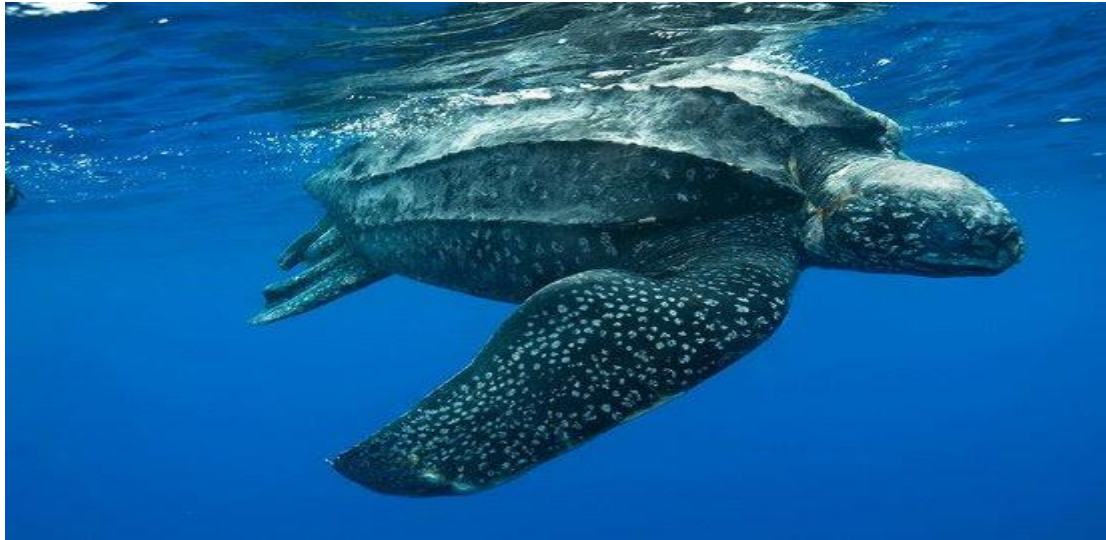
Rùa da không lỗ ( Dermochelys coriacea ).