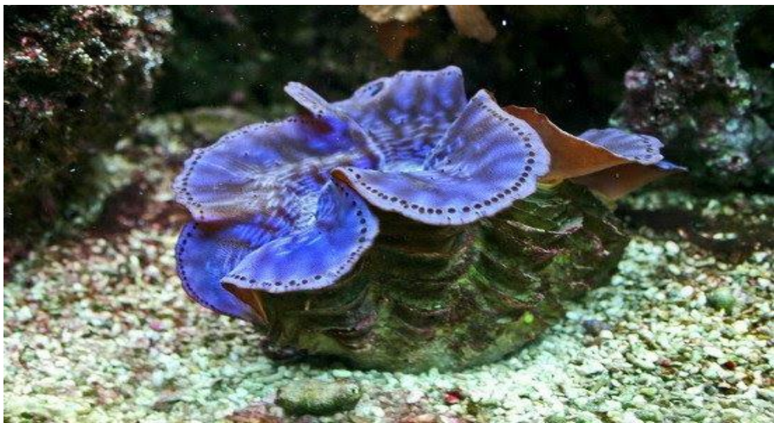
Trai tai tượng lớn ( Tridacna maxima ).

Dưới đây là một số loài nằm trong danh sách bảo tồn của Việt Nam.