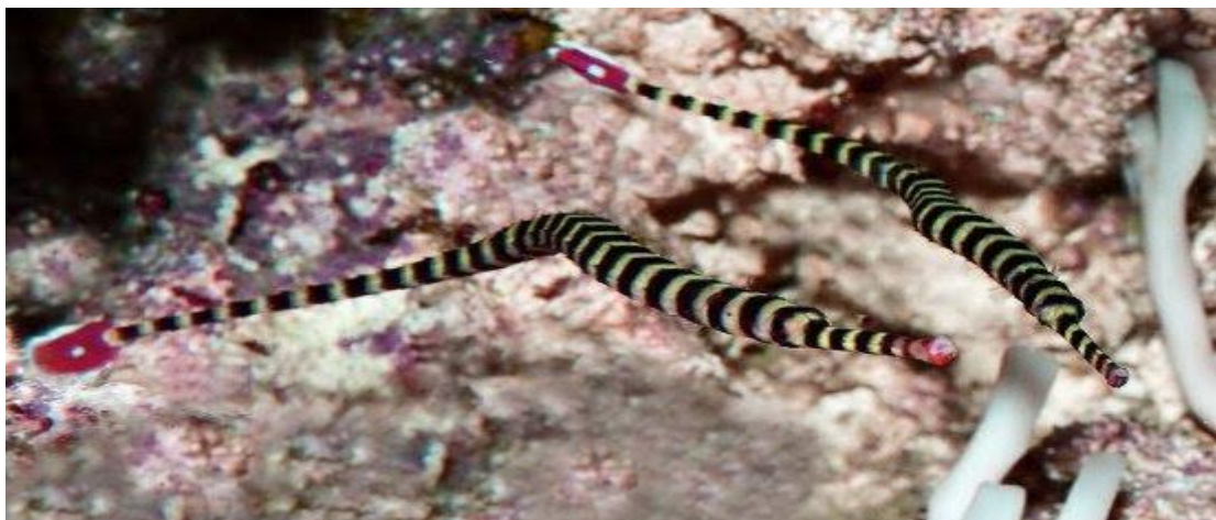
Cá Chìa vôỉ khoang vằn ( Doryrhamphus dactyliophorus ).