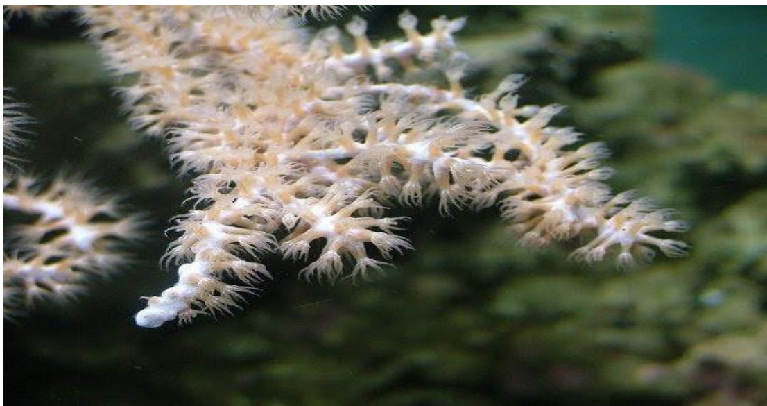
San hô trúc ( Isis hippuris ).