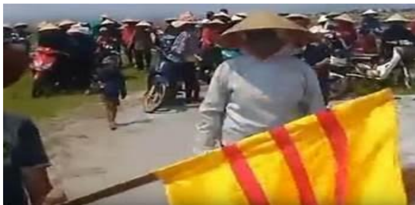
-Cờ Vàng, phản đối, khi CSVN cưỡng chiếm. quy hoạch!