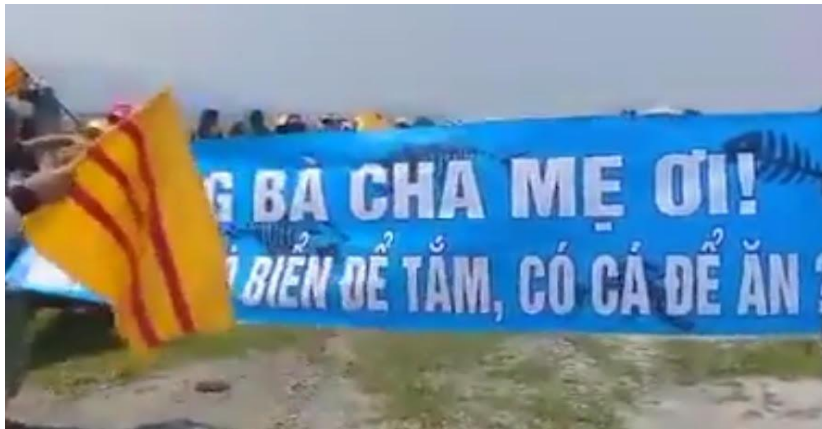
-Cờ Vàng, biểu tượng đấu tranh, cá chết, vụ Formosa!