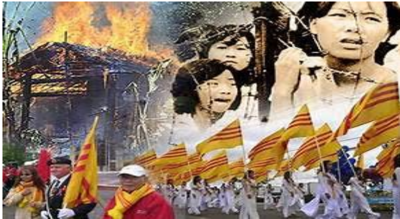
-Cờ Vàng, biểu tượng của Người Việt Tị Nạn CS.