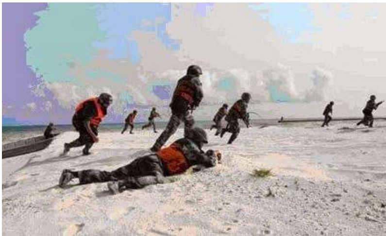
Lính Trung Quốc tập trận đổ bộ chiếm đảo bất hợp pháp tại Trường Sa tháng 5 năm 2013

(GDVN) - Lịch sử các cuộc xung đột ở Biển Đông cho thấy rằng các căn cứ này có thể được sử dụng như bàn đạp cho các cuộc tấn công nhằm vào các đảo/đá/rặng san hô gần đó