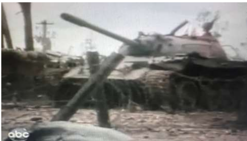
Xe Tank Bắc quân bị Tiểu Đoàn 63 Pháo binh bắn cháy bên hông BV2DC

Một ông Quan hai nói-Khi mấy ông bỏ chạy, tụi tui rụng rời xe kéo Pháo thì bị bắt khiến dụng vì ăn pháo, một Tiểu Đoàn Pháo 105 và 155 nặng thí mẹ làm sao mà dùng xe dodge kéo, tụi tôi phối hợp với Đại đội Thám kích phòng thủ, chúng tôi chơi Hỏa tập cận phòng, dùng đạn lân tinh bắn chiến xa tụi nó, mẹ lần đầu nghe tiếng xe Tank VC muốn bỏ chạy, con mẹ mà chạy đi đâu? tụi tôi bắn tụi nó cháy vài chiếc chúng khựng lại không có bộ binh tưng thiết, tụi Bộ đội chưa theo kịp đến được vì bị toán Thám kích đánh cách đó mấy trăm thước, ông Sĩ quan kể chuyện huyền thuyên ông đánh trận một lần nữa trên cái bàn gỗ thông của thùng đạn nghe sáng khoái vô cùng