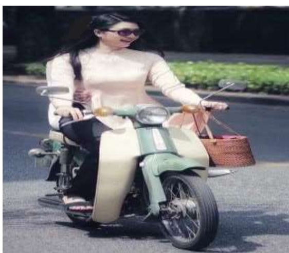
Hình tượng trưng

Hai ly Cà phê đặc quánh đang nhỏ từng giọt thành hơi có hương vị rất độc đáo nó thum thum không biết ai đã tìm ra hương vị này, mà nuôi Chồn cho ăn trái Cà phê để lấy cứt nó được tìm thấy vào Thế kỷ 18 tại Indonesia lúc này là thuộc địa của Hòa Lan, mà phải là loại Chồn hương mới có giá trị,khi nó ăn vào không tiêu hóa được lõi hạt tồn đọng trong dạ dày, quặn với mùi hương rồi thải ra, người ta nhặt vào rang sấy chế biến lại nhưng vẫn giữ một mùi hương tuyệt vời nên khi bán rất có giá, Tôi may mắn lắm mới quen một nường con gái có một rẫy Cà phê gần biển hồ, chuyện quen nhau thật tình cờ thôi