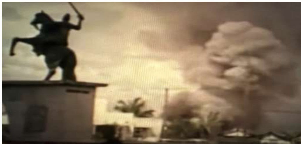
Pháo Bắc Quân dội xuống Thành phố Kon Tum

Chiếc PT 76 hết xăng nằm đó đến trưa thì có xe đến kéo đi đâu mất, làm tụi tui muốn són đái mụ nội xe gì hình thù ghê quá, nghe nói được chở về Sài Gòn làm quà cho ông Thiệu, mà tôi quên mất phải chi leo lên chụp một tấm hình, như mấy thằng Mỹ chụp trên hai chiếc T54 của Bắc quân bị bắn cháy kéo về bờ nơi sân Vận Động,