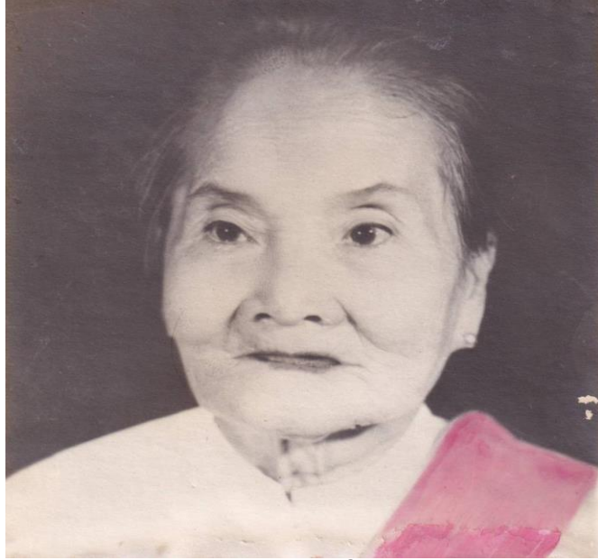
Hình Mẹ Tôi - trên dưới 80 tuổi mà tóc chưa bạc nhiều

Mẹ tôi thật đau buồn tiễn con trai cùng con dâu vào trại tập trung cải tạo. Tôi "hân hạnh du học" trên đất Bắc: Sơn La, Yên Bái, Vĩnh Phú, được nhà nước cộng sản chiếu cố ưu ái cấp bằng tiến sĩ cải tạo phải mất 8 năm ở đất Bắc và 2 năm ở miền Nam học sau đại học ở Rừng Lá Hàm Tân Z30D. Còn bà xã tôi cũng học tròn ba năm ở miền Nam. Khi "ra trường" có bằng cử nhân cải tạo lại không được ở Sài Gòn với các con mà phải về Châu Đốc, quê của chồng, để được quản chế.