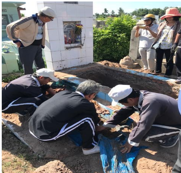
Hình: ngôi mộ Mẹ, bốc lên lấy di cốt còn lại - tôi đứng nhìn ảnh Mẹ

Từ Mỹ, tôi và hai cháu ngoại đi về Việt Nam - Tây Ninh lo công việc cải táng Mẹ về Nhà Bàng - Châu Đốc. Các con tôi ở Mỹ và các cháu ở Việt Nam họp sức cáng đáng hết mọi công việc cải táng, mướn xe khách lớn chở cả đại gia đình ở Tây Ninh, Sài Gòn cùng về quê hương Châu Đốc.