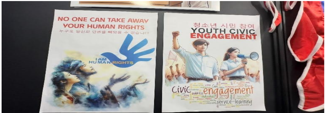
Tuổi trẻ Việt Nam anh hùng sát cánh cùng thế giới