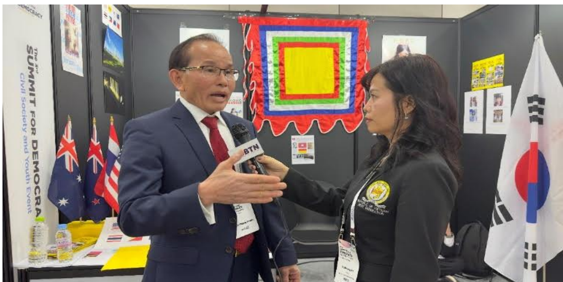
Bên cạnh sự hướng dẫn của các thế hệ đi trước