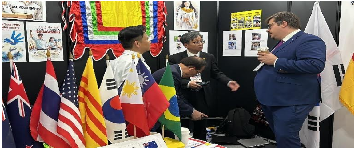
Chúng ta đã sẵn sàng