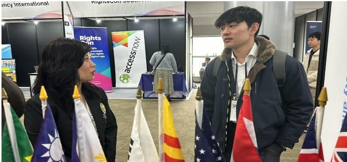
Cho một cuộc chiến toàn cầu giữa tự do và nô lệ, giữa thiện và ác