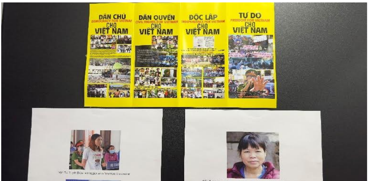
Vì lý tưởng không phai nhạt với thời gian