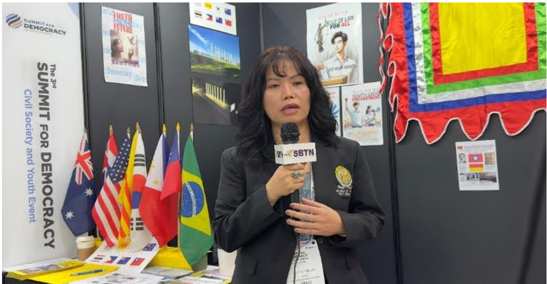
Hậu duệ Việt Nam Cộng Hòa, tại Thượng Đỉnh Dân Chủ Thế Giới