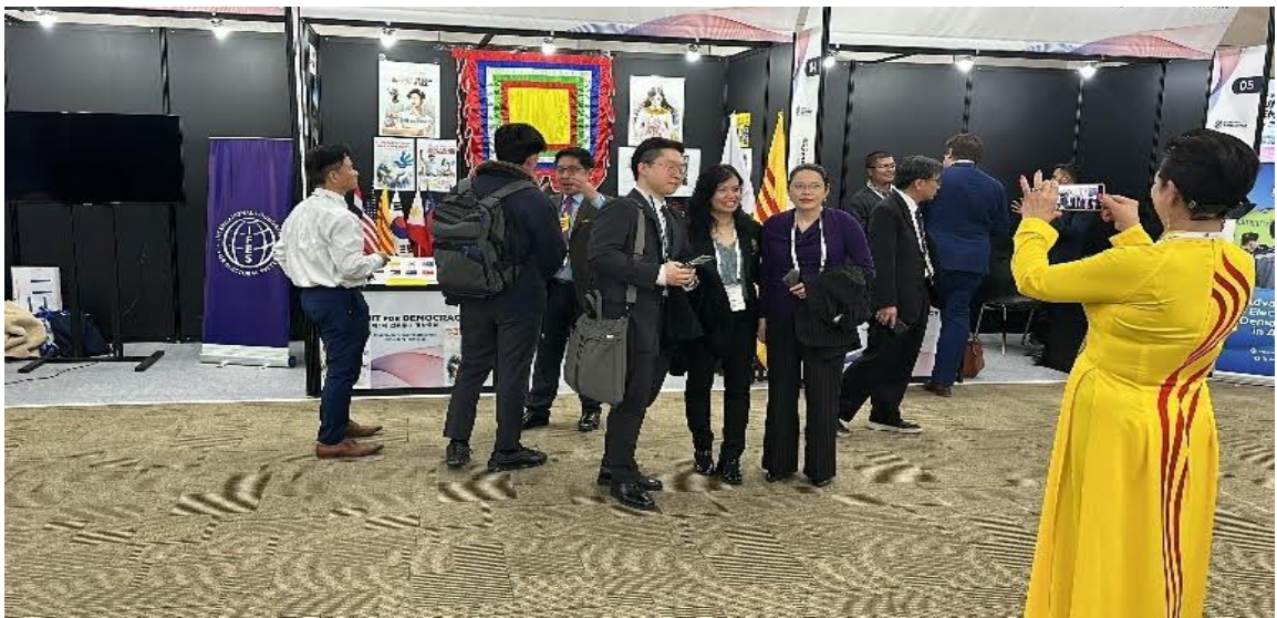
Để làm những viên gạch lót đường