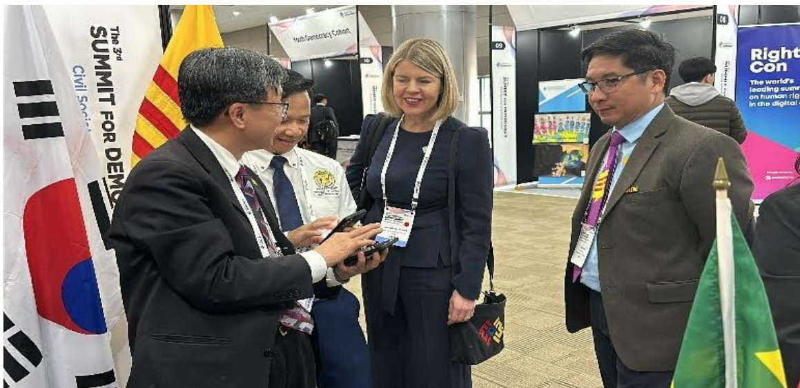
Sánh vai với lãnh đạo của thế giới tự do