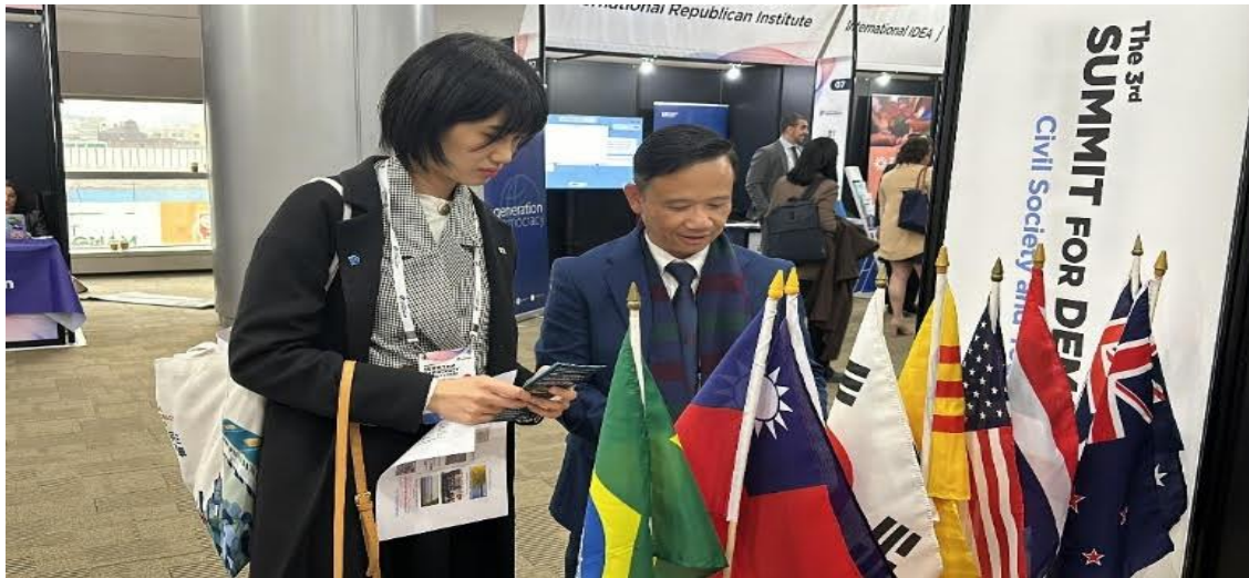
Với sự quan tâm của người Nam Hàn, quốc gia tổ chức Thượng Đỉnh