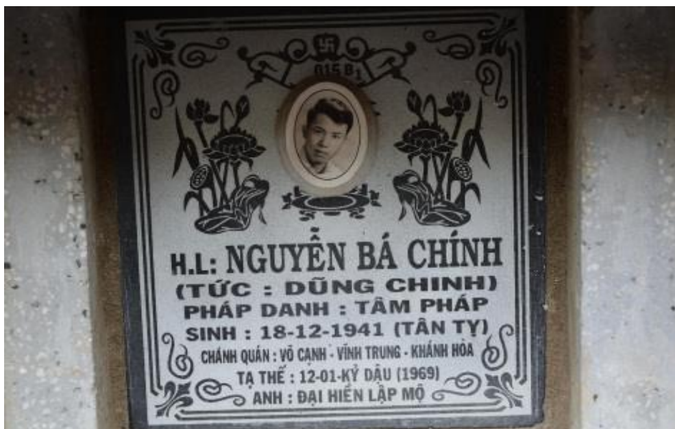
(Kim tĩnh của NS Dzũng Chinh) (***)

Sau này, chính quyền CS đã cho giải tỏa khu nghĩa trang này để lập chợ mới Phương Sài, gia đình đã hỏa táng và mang tro cốt (kim tĩnh) về thờ tại Khu Tượng Kim Thân Phật Tổ, thuộc Chùa Phật Giáo Tỉnh Hội Khánh Hòa (Chùa Long Sơn?)