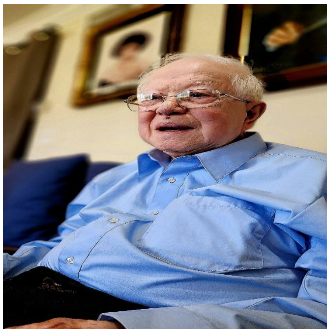
Một người Việt Nam

từ nhiều góc cạnh: Một người liêu lĩnh ra biển, một nhà nhiếp ảnh có những góc nhìn khác biệt, một nhà giáo dục ân cần và một người viết nhạc – viết ra những tác phẩm cao quý, ngay cả trước khi được học nhạc.