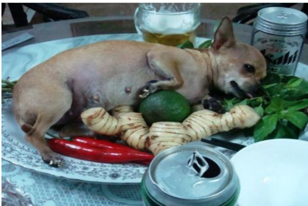
Đúng rồi Mộc Tồn.

cho Chó. Nói tắt, trong tiếng Việt khi nói thịt Cầy là người ta ám chỉ đó là thịt Chó chứ không là con vật nào khác và khi một ai đó làm thịt một con Cầy (Chồn) thực thụ thì họ lại nói rõ đây là Cầy, không phải Chó. Ngày nay thì dân miền Nam có nhiều người ăn được thịt Chó y như dân miền Bắc và họ còn chế biến thêm nhiều món ăn khác mới từ thịt con vật này nữa.