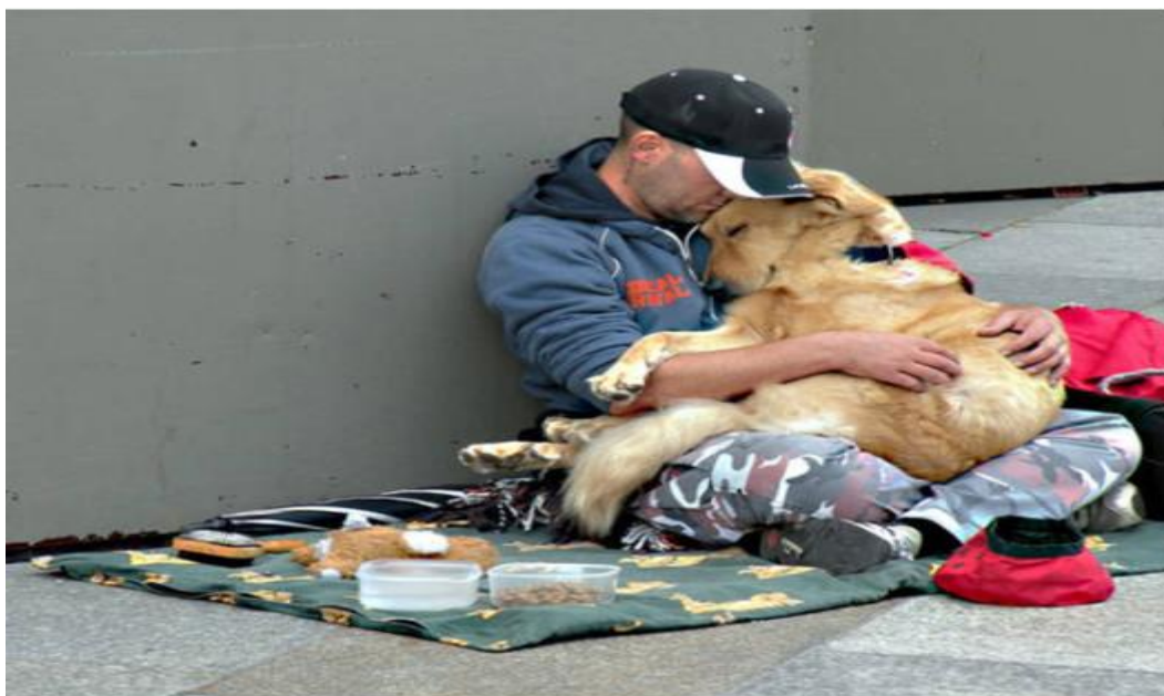
Chó không chê gia chủ nghèo

– Muốn giết một con Chó, chỉ cần bảo nó bị bệnh dại: Vu oan cho người lành vô tội.