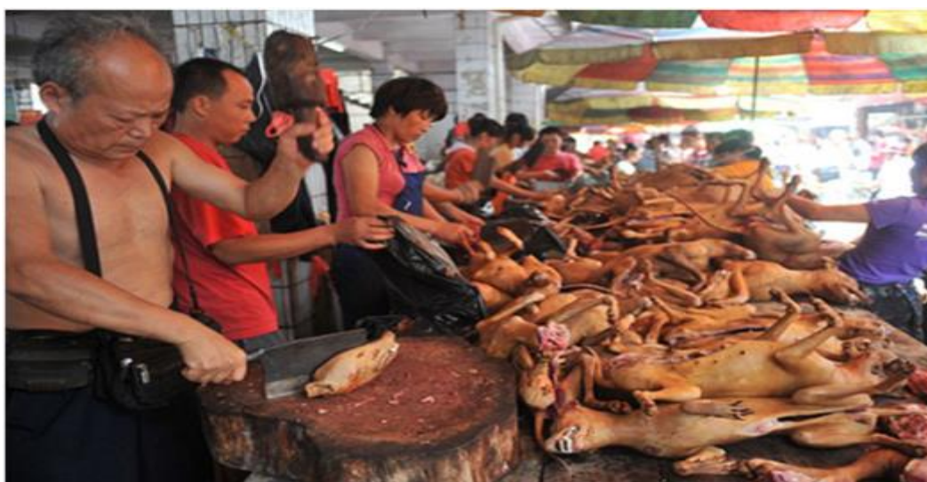
Một chợ bán thịt Cầy bên Tàu.

lạy ông ta xin được tha mạng nhưng vẫn không thoát. Một tiệm thịt Chó ngoài miền Bắc (vùng Nhật Tân) phải đóng cửa giải nghệ vì lý do: người chủ ngã vào chảo nước sôi cạo lông mà chết. Có ông chủ tiệm Nai Đồng Quê đột nhiên phát bệnh dại và chết nhanh chóng. Tìm hiểu nguyên do, ông ta mua phải con Chó mắc bệnh, khi làm thịt vì tay có vết xước và vô tình để dính vào nước bọt của Chó nên nhiễm trùng mà không biết để chích ngừa.