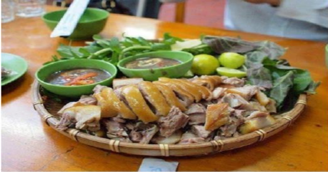
Một met thịt Cây kiệu Việt Nam.