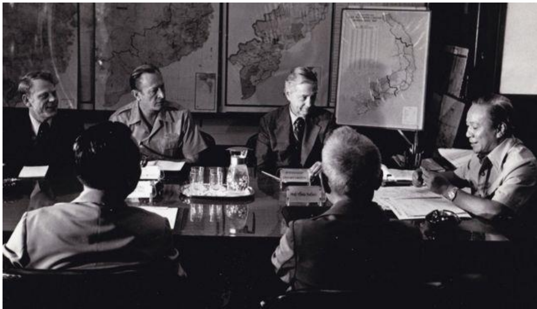
TT VNCH Nguyễn Văn Thiệu (bìa phải) trong một cuộc họp với Đại sứ Hoa Kỳ Graham Martin, người thứ nhì trong hình từ phải sang, đang nhìn vào ông.

Yếu tố thứ hai tạo ra căng thẳng lớn ngày hôm đó, là chúng tôi nhận được tin từ Hà Nội - một tín hiệu giả, rằng Bắc Việt sẵn sàng cho phép Tòa Đại sứ Hoa Kỳ ở lại Sài Gòn sau khi ngừng bắn. Điều đó có nghĩa là có vẻ như Bắc Việt sẽ không xóa sổ miền Nam VN, họ sẽ cho phép một chính phủ Nam VN được tồn tại ngay cả khi Bắc Việt chiếm xong được Sài Gòn. Và nếu chính phủ này tồn tại, thì Tòa Đại sứ Hoa Kỳ có thể tiếp tục hoạt động tại Sài Gòn. Vì vậy, giới lãnh đạo nuôi kỳ vọng vào sáng 25/4, là đơn giản chỉ cần ông Thiệu biến mất, thì một phép màu sẽ xảy ra.