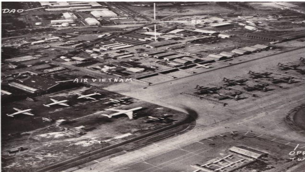
Phi trường Tân Sơn Nhất những ngày cuối cùng của VNCH

Bối cảnh xung quanh việc đưa ông Thiệu ra khỏi VN đã diễn ra như thế nào, thưa ông?