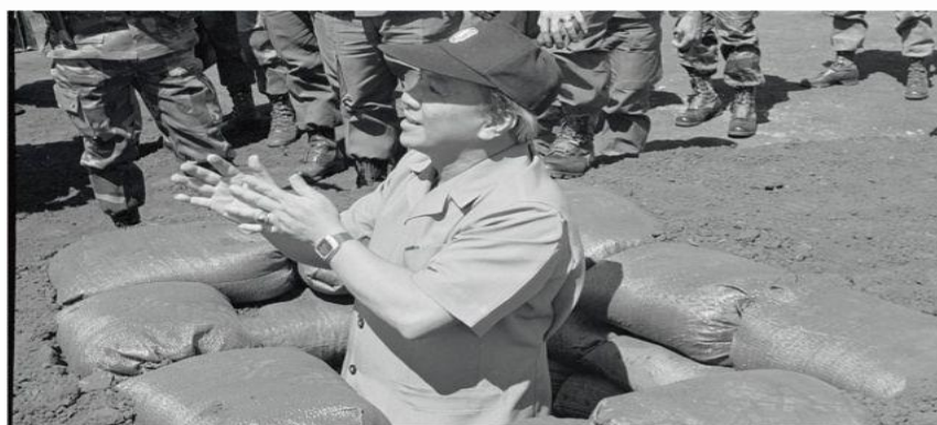
Tổng thống VNCH Nguyễn Văn Thiệu hồi tháng Hai 1975

Frank Snepp: Tôi không ghét ông ấy. Tôi chỉ đơn giản muốn ông được an toàn đến sân bay. Nhưng tôi không có ảo tưởng nào về sự thù địch mà ông Thiệu phải đối diện ở khắp nơi. Với tư cách cá nhân tôi vô cùng xúc động khi thấy một người đang lâm cảnh tột cùng tuyệt vọng. Tôi cũng kinh ngạc thấy ông có thể tự chủ được đến vậy. Ý tôi là, đang phải đối mặt với sự sỉ nhục lớn nhất mà bất kỳ tổng thống nào của một nước phải đối mặt mà ông vẫn kiềm chế được, nhưng lại rơi nước mắt cho những người Mỹ đã hy sinh ở VN. Khoảnh khắc ấy tôi không bao giờ quên. Đoàn xe tiếp tục đi. Có lúc chúng tôi bị chặn lại. Thấy ông đại tá cảnh sát người Việt trong xe đi đầu nói chuyện với những người ở trạm kiểm soát, tôi đã nghĩ chết cha, có thể gặp chuyện rồi, đây có thể là lúc súng sẽ nổ và mọi người sẽ chết. Nhưng chúng tôi được vẫy tay cho đi. Rồi cũng đến khu vực của phi trường, nơi chúng tôi sẽ bàn giao ông Thiệu, ông Khiêm và những người còn lại trong nhóm họ. Tất cả đèn thành linh tắt ngúm. Trời tối đen như mực. Tôi làm mờ đèn xe đi như được yêu cầu và cứ thế lái trong bóng tối, không nhìn thấy gì.