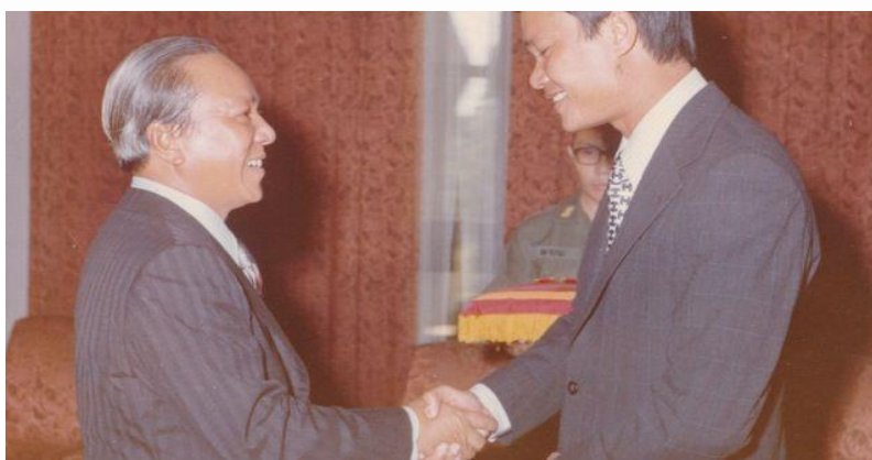
TT Thiệu trong một lần trao tặng huân chương cho ông Hoàng Đức Nhã

Bỗng nhiên, ngay phía trước xe, trong bóng tối mù mờ, tôi thấy sếp Polgar đang chạy xuống phi đạo. Xe tôi suýt nữa đụng vào ông. Tôi thắng gấp và mọi người ở đằng sau bay về phía trước, đập vào lưng ghế của tôi. Ông Thiệu và tướng Timmes bị trượt khỏi ghế ngồi. Quang cảnh lúc ấy giống một khúc phim hài, nhưng đồng thời cũng rất khủng khiếp. Tôi xin lỗi, và xe nhích về phía trước.