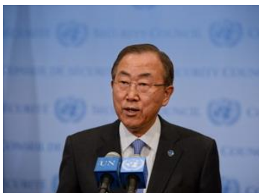
Tổng thư ký LHQ kêu gọi một thế giới phi bạo lực

Nhân Ngày Quốc tế Phi bạo lực, Tổng thư ký LHQ đã gửi bức thông điệp kêu gọi mọi người dân trên thế giới dừng cầm phản đối bạo lực.