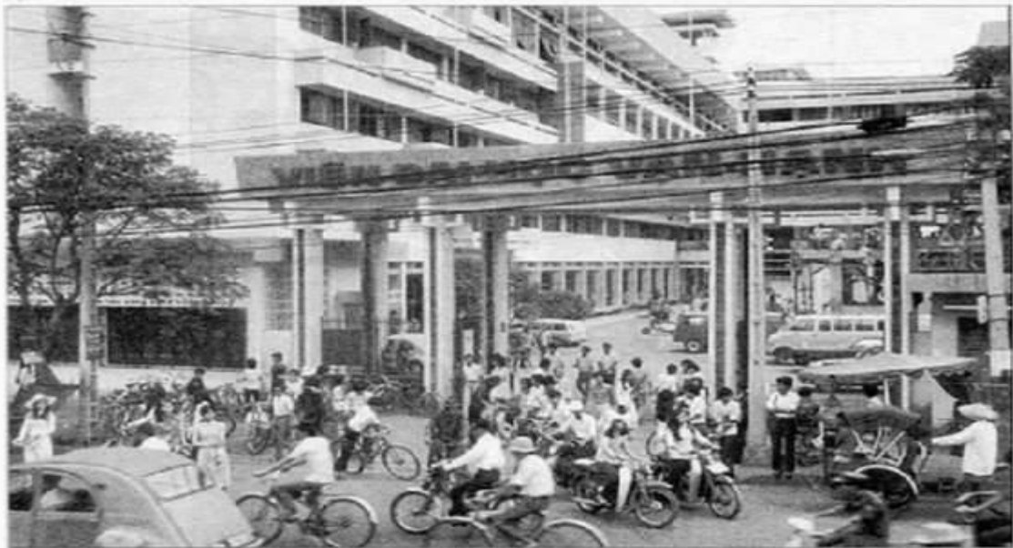
Mái trường Viện Đại học Vạn Hạnh ngày xưa