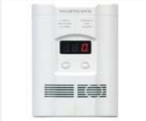
Hình chiếc máy báo động có khí độc “Carbon Monoxide”

vài tên gọi như “Carbon Monoxide Alarm”, “ hoặc “Carbon Monoxide Detector”... Mỗi tư gia, văn phòng làm việc nên có ít nhất một cái, hoặc vài cái. Có những chiếc máy chỉ cần cắm vào ổ điện trong nhà là xong. Mỗi chiếc máy khoảng 20-30 Mỹ kim. Nếu mua chừng vài cái hầu đề phòng chuyện rủi ro thì giá tiền của nó rẻ hơn giá mua một chai rượu Tây, hay một vé vào cửa cho một dạ tiệc, khiêu vũ... nhưng nó lại cứu được sinh mạng nhiều người.