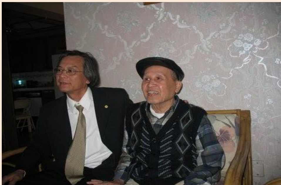
Thành kính phân ưu cùng tang gia và bà quả phụ nhà văn Võ Phiến (Viễn Phố)