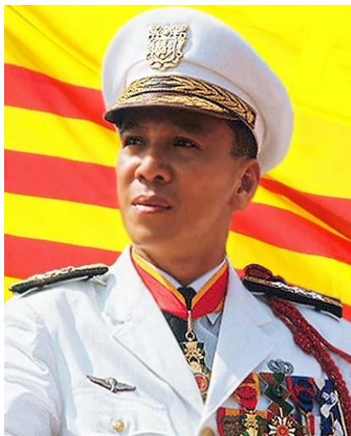
Tổng Thống VNCH Nguyễn Văn Thiệu (1923-2001)