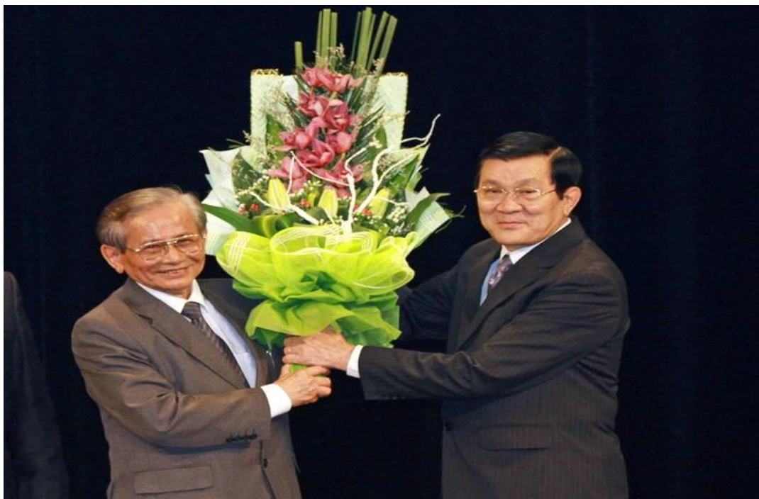
Nguyên chủ tịch nước Trương Tấn Sang tặng hoa cho giáo sư Phan Huy Lê.

Thầy đặc biệt quan tâm đến vấn đề chủ quyền lãnh thổ. Đó cũng là lý do từ năm 1992, Thầy đã là người gợi ý tôi chủ nhiệm đề tài lịch sử về chủ quyền Việt Nam ở Trường Sa, Hoàng Sa, dù khi ấy, vấn đề biển đảo vẫn chưa được đề cập nhiều như bây giờ. Đó là mẫn cảm lịch sử của một nhà lịch sử tâm huyết, tài năng.