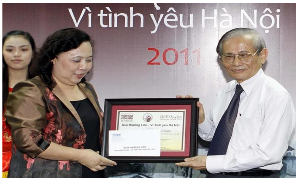
Giáo sư Phan Huy Lê nhận giải thưởng Bùi Xuân Phái.

Thầy trở thành một trong những nhà sử học hàng đầu cả nước từ khi còn rất trẻ, chưa đầy 30 tuổi. Tầm của một người đứng đầu đã hình thành từ rất sớm, nhưng giữ được lâu như vậy trong khi nền sử học luôn luôn thay đổi, với nhiều sự tác động của xã hội, thì đó là điều rất đặc biệt. Đó là vì Thầy đã không ngừng nghiên cứu khoa học và liên tục cập nhật tri thức mới. Với hàng trăm công trình khoa học, có thể hình dung toàn bộ trước tác của Giáo sư Phan Huy Lê được chia ra thành 7 lĩnh vực và lĩnh vực. Thật hiếm có một học giả có khối lượng các công trình nghiên cứu đồ sộ và đạt đến đỉnh cao trên nhiều lĩnh vực chuyên môn như thế.