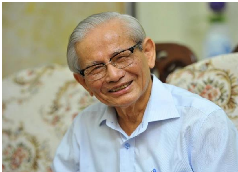
Nhà sử học, nhà giáo nhân dân Phan Huy Lê.