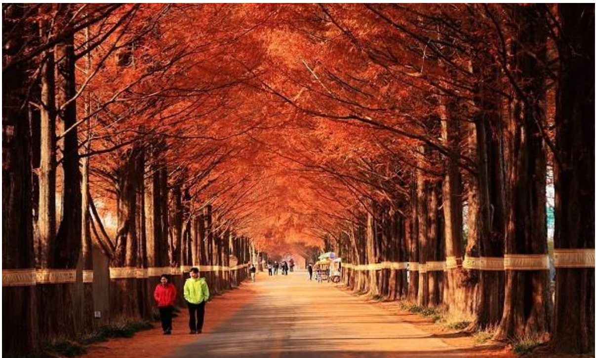
... rực rỡ khi vào thu...

Những cây thủy sam ở đây đã hơn 40 tuổi và cao hơn 20m. Những tán cây đan vào nhau, che chắn ánh nắng Mặt trời. Vào mùa hè, tán cây thủy sam như cao vút hơn với màu xanh mướt.