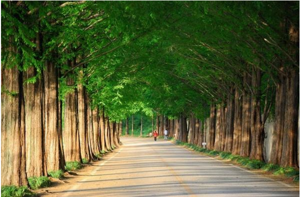
Con đường Thủy sam khi còn xanh mướt...

Những cây thủy sam ở đây đã hơn 40 tuổi và cao hơn 20m. Những tán cây đan vào nhau, che chắn ánh nắng Mặt trời. Vào mùa hè, tán cây thủy sam như cao vút hơn với màu xanh mướt.