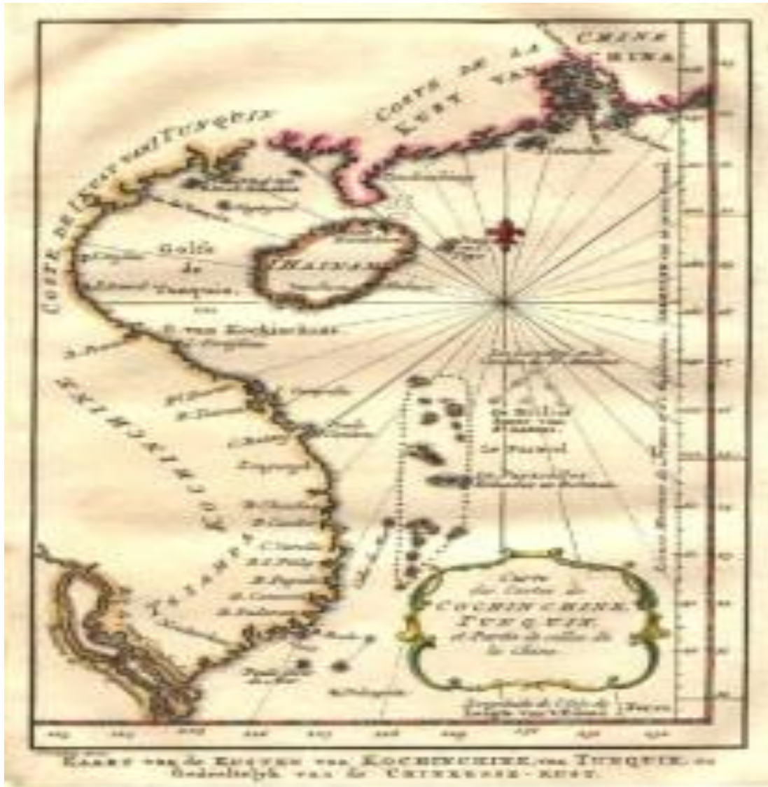
Bản đồ Biển Đông do người Hà Lan vẽ vào năm 1754 ghi nhận quần đảo Hoàng Sa dưới tên De Paracelles