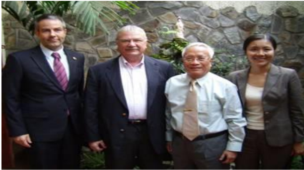
Nguyễn Đan Quế

Bên Phật Giáo, có Hòa thượng Thích Quảng Độ can cường, không chịu thoả hiệp. Hoà Thượng Thích Quảng Độ từng là Viện trưởng Viện Hóa Đạo, hiện là Đệ Ngũ Tăng Thống của Giáo Hội Phật Giáo Việt Nam Thống Nhất. Ông là vị lãnh tụ tinh thần tối cao của Phật Giáo phi quốc doanh. Vì những hoạt động này, và nỗ lực khôi phục Giáo Hội Phật Giáo VN Thống Nhất, trái ý đảng cộng sản, Hòa Thượng Thích Quảng Độ đã bị Hà Nội giam cầm nhiều năm. Ngược lại, ông cũng là nhân vật gây được nhiều chú ý trong dư luận quốc tế, thậm chí đã hơn một lần được đề cử cho giải Nobel Hòa Bình