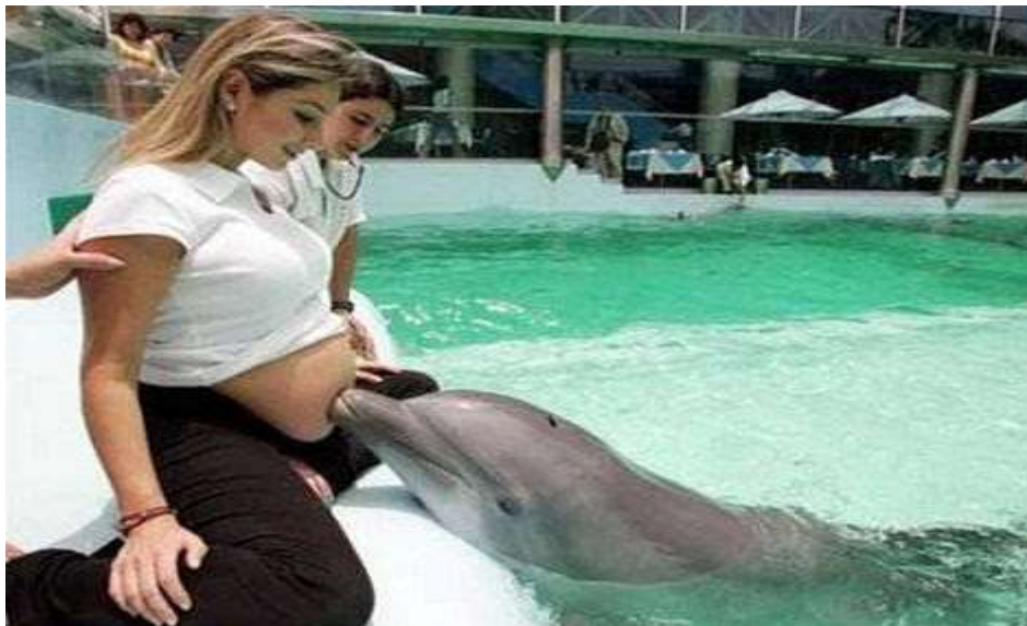
Tại Lima, Peru, các phụ nữ mang thai có thể thử liệu pháp cá heo để kích thích não của các em bé bên trong bào thai phát triển.