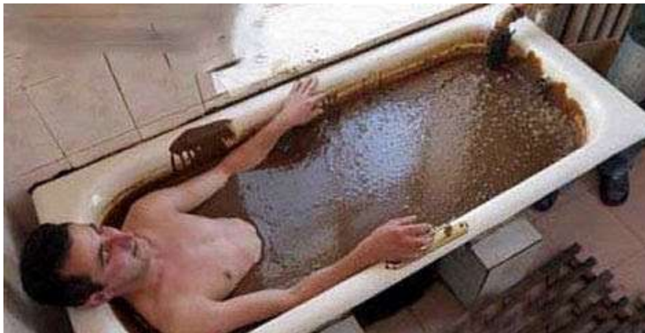
Tắm trong dầu thô tại Azerbaijan để dưỡng da và chữa các bệnh ngoài da, bệnh thấp khớp, viêm khớp.

Tắm trong dầu thô, cho đĩa đốt hay vùi mình trong cát nóng... là những phương pháp chữa bệnh kỳ quặc được áp dụng trên thế giới.