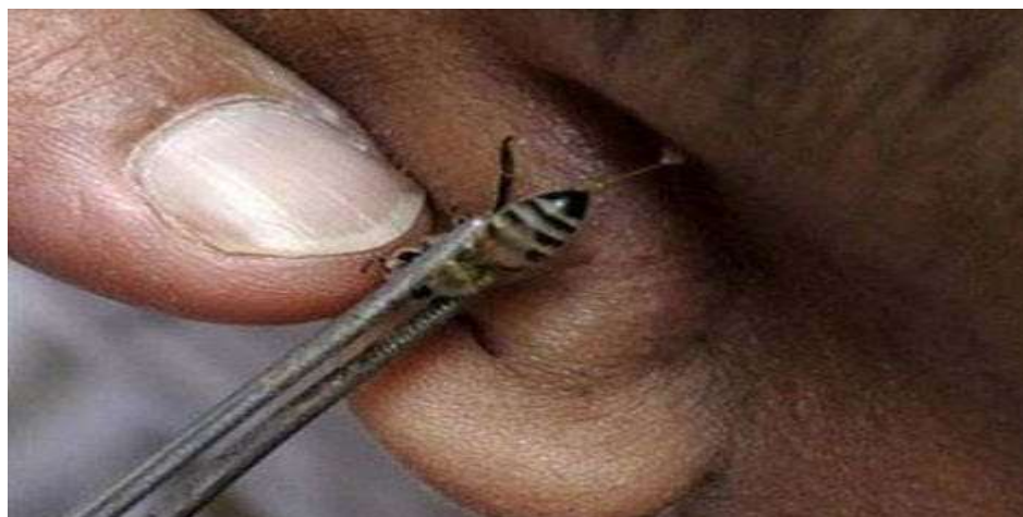
Ong đốt được sử dụng để chữa bệnh về thận, bệnh viêm ruột thừa và thậm chí các bệnh ung thư tại Cairo, Ai Cập.