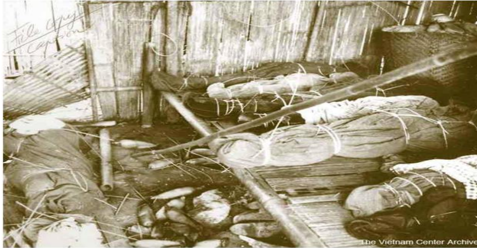
Dak Son Massacre - Bodies wrapped in available material await burial in one of the few remaining huts. These bodies were removed from a tunnel shelter.

Tổng cộng 252 dân làng đã bị giết trong cuộc tàn sát này, đa số là đàn bà và trẻ em.