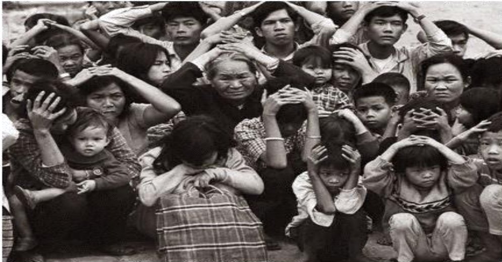
Việt Cộng tập trung đồng bào Huế để tìm bắt quân nhân và công chức VNCH

Trong 28 ngày chiếm giữ Huế, bọn Việt Cộng (bộ đội Bắc Việt và quân đội Giải Phóng Miền Nam) ngày nào cũng đi lùng bắt giết các quân nhân VNCH nghỉ phép về nhà ăn Tết và viên chức của VNCH. Những người dân thường không theo chúng, chúng cũng bắt và giam giữ tại nhiều nơi khác nhau. Số người bị bắt giam vào khoảng gần 10,000 người.