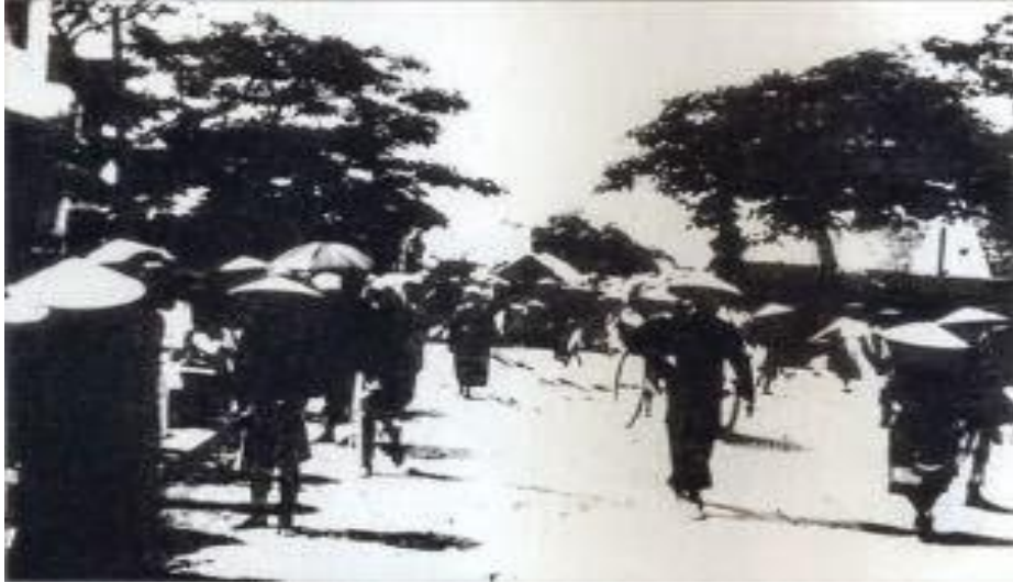
Cuộc nổi dậy ở Quỳnh Lưu 13-11-1956-(Nghệ An)