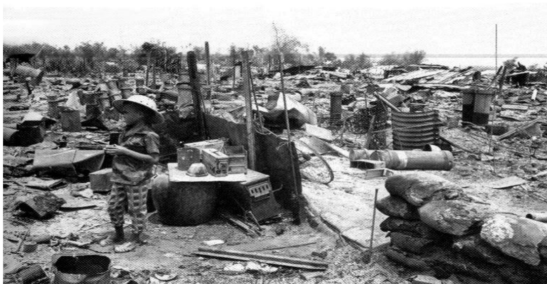
Làng Dục Đức sau ngày 28-31/3/71

Vào tháng 8 năm 1970, khi những người lính Mỹ cuối cùng đã rời làng Dục Đức. Bảy tháng sau đó vào ngày 28 tháng 3 năm 1971, hai trung đoàn bộ đội cộng sản Bắc Việt đã tấn công tàn sát, giết chết cả 100 dân làng gồm đàn ông, phụ nữ, trẻ em, làm bị thương hơn 150 người và đốt cháy khoảng 800 ngôi nhà.