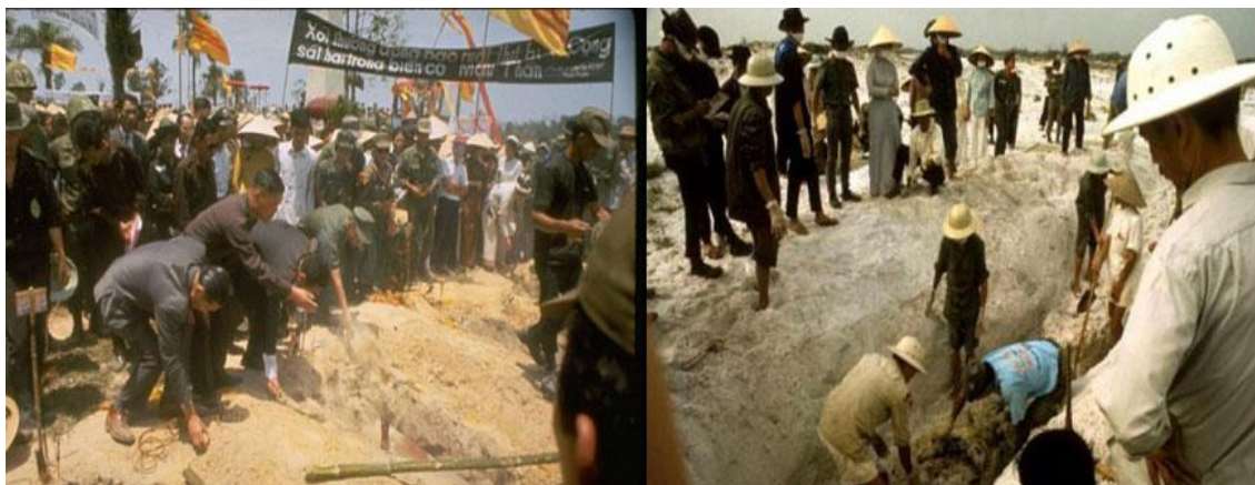
Một hầm chôn tập thể ở Huế được khai quật

Khi quân đội VNCH phản công và tái chiếm thành phố Huế, để dễ dàng và an toàn cho cuộc rút lui, chúng đã bắt những người dân mà chúng đang giam giữ, đào những hầm hố lớn, nói là, nói là để làm hầm trú ẩn. Đào xong, chúng xả súng bắn vào họ rồi lấp đất chôn họ luôn. Nhiều người chưa chết, chúng cũng chôn luôn.