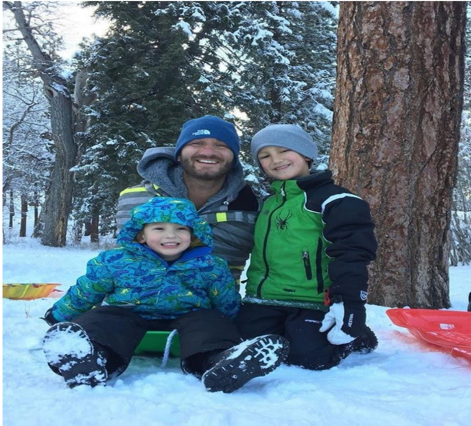
Nick Vujicic dạy các con sống bản lĩnh và lan tỏa năng lượng tích cực giống mình! (Ảnh: Instagram).