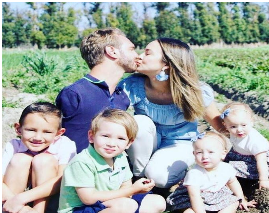
Tổ ấm hạnh phúc của Nick Vujicic khiến nhiều người ngưỡng mộ! (Ảnh: Instagram).

Sự xuất hiện của CÁC CON cũng mang lại cho Nick những trải nghiệm thú vị, trở thành chất liệu tuyệt vời để anh thực hiện những cuốn sách sau này! "Những ĐỨA TRẺ là món quà Chúa đã ban tặng cho tôi! Chúng tôi đã từng ước sẽ có 2 TRAI, 2 GÁI và giờ đây mọi thứ thật TRỌN VẸN và HẠNH-PHÚC!" , anh chia sẻ.