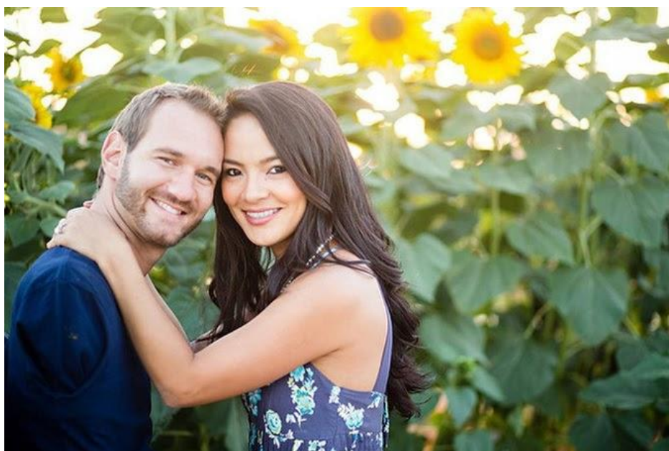
Nick Vujicic và người bạn đời của mình!.

Anh tốt nghiệp Đại-Học năm 21 tuổi, với tấm bằng kép ngành Kế-Toán và Kế-Hoạch Tài-Chính. Sau đó, anh trở thành một DIỄN-GIẢ đặt chân tới nhiều nơi trên thế giới, khích lệ mọi người KHÔNG BỎ CUỘC và LUÔN TÌM THẤY NIỀM VUI TRONG CUỘC SỐNG!