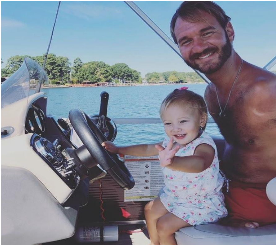
Làm Cha mang lại những trải nghiệm thú vị cho Nick Vujicic! (Ảnh: Instagram).