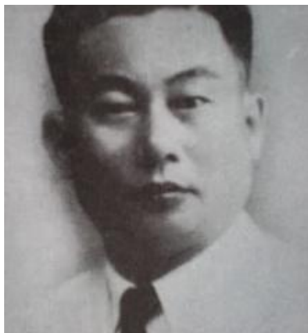
Ông Mã Tuyên thời 1963