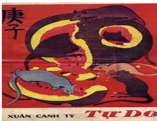
Bìa báo Tự Do, Xuân Canh Tý 1960