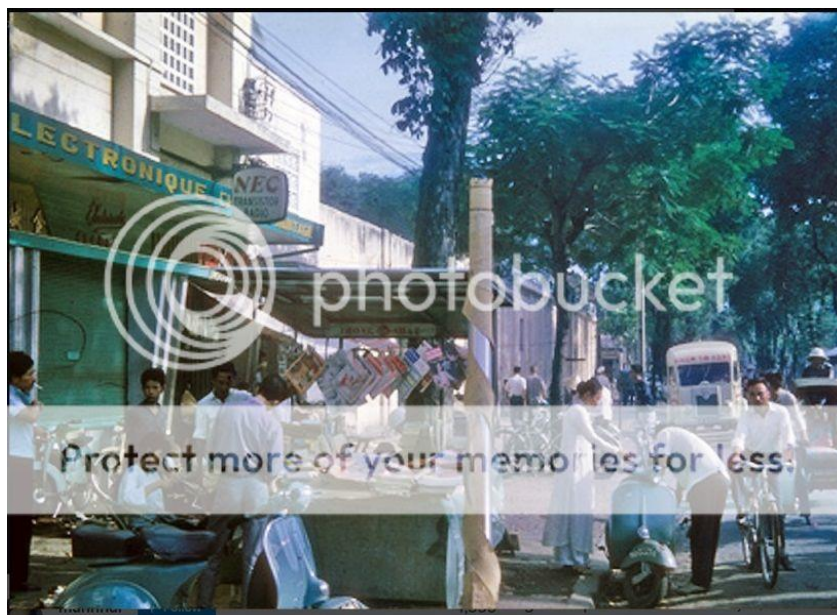
Một quầy báo ở Sài Gòn thập niên 1960

Lê Thị Huệ: Nhật báo Tự Do theo lời ông kể thì đó là tờ báo của giới trí thức Bắc Kỳ di cư. Nghe nói đó là tờ báo số một vào thời điểm 1957. Tại sao ông lại bỏ đi. Tờ Tự Do có phải là tiền thân của tờ Sáng Tạo. Theo ông vai trò các ký giả trong giai đoạn thành lập Việt Nam Cộng Hòa đã có những khai phá hoặc những thành tích nào đáng ghi nhận.