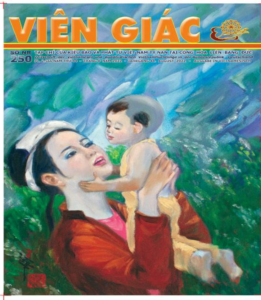
Tạp Chí số 250

Niềm đau nổi xót tự nhiên tràn ngập trong lòng tôi! Có thể lá cờ thiêng liêng của người Việt quốc gia ty nạn cộng sản đã bị xóa nhòa như vậy ư? Phải chăng ban biên tập tờ báo Viên Giác đã cố tình phi tang quá khứ và xóa bỏ một giai đoạn lịch sử ngập tràn nước mắt quê hương?