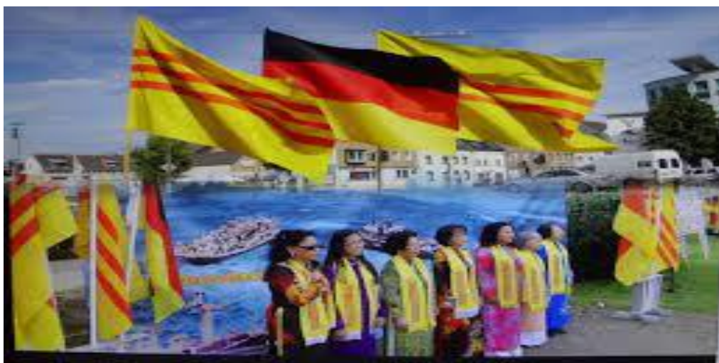
Ngày tưởng niệm thuyền nhân Việt Nam và tri ân nước Đức tại Troisdorf (29-8-2015)