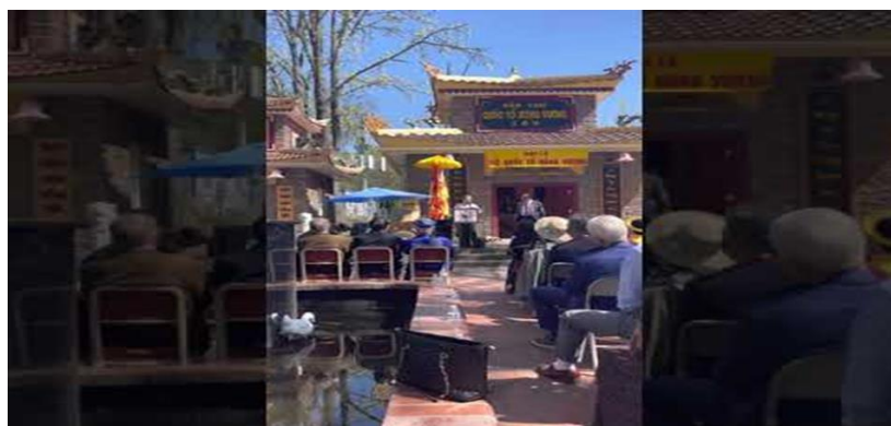
Hình tác giả diễn ngâm bài thơ Tạ Tội

https://vantholacviet.com/ta-toi-hoang-mai-nhat/