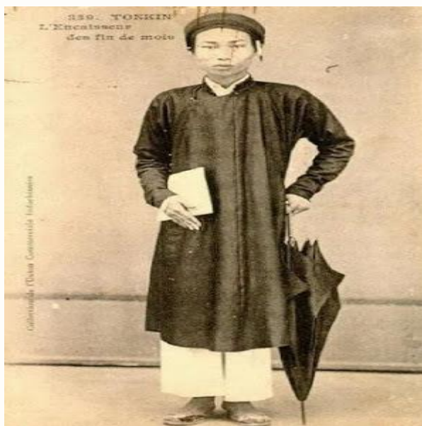
Hình một nhân viên thu thuế chợ, đầu thế kỷ XX

Về chi tiết, thông thường bên trong người ta mặc một bộ “bà bà trắng”, tức là quần dài, áo tay dài từ thân, ngày xưa áo tay dài ngũ thân còn có tên gọi là “áo vạt mẹ”. bên ngoài mới mặc chiếc áo dài ngũ thân, trên đầu quần khăn hoặc đội khăn đóng, chân đi giày.