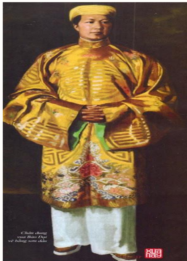
Tranh vẽ Hoàng đế Bảo Đại

Còn màu vàng dành cho hoàng phái tức là vua và các thân tộc của nhà vua.