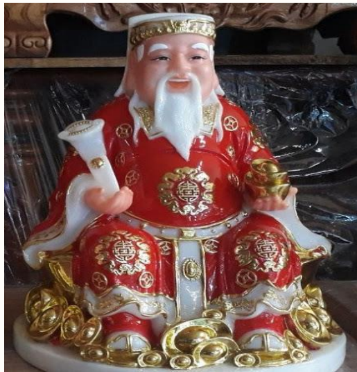
Tượng Thần Tài mặc y phục đỏ

Hai màu sau đây người ta không mặc, được quy định màu đỏ dành cho các vị thần, tiên để người ta thờ cúng.