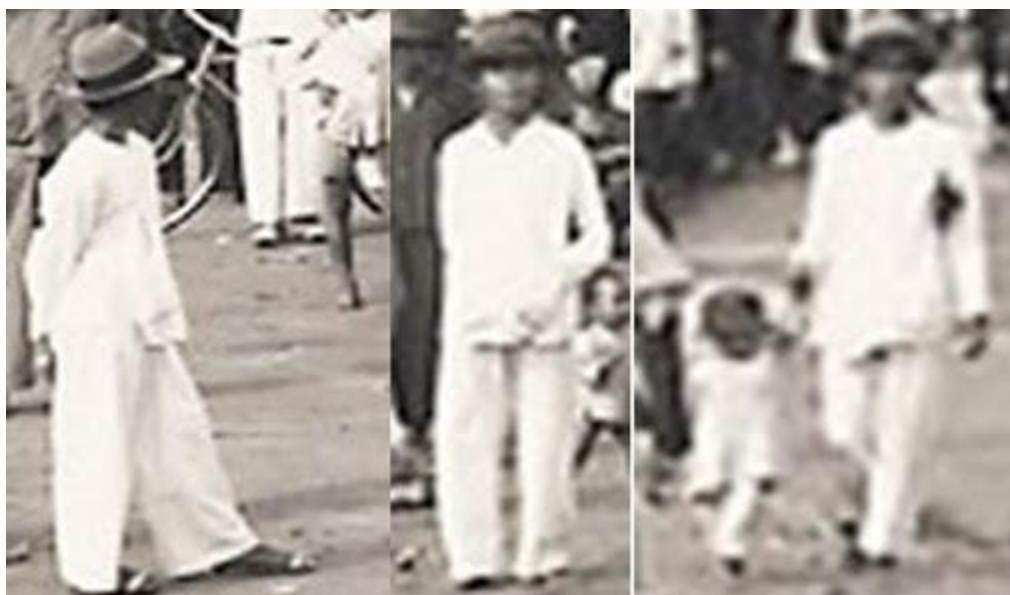
Những người đàn ông này mặc bộ Bà Ba đi chợ Bạc Liêu khoảng năm 1930

Bộ đồ bà ba mặc lót bên trong chúng ta thường thấy, đơn giản chắc khời bàn đến