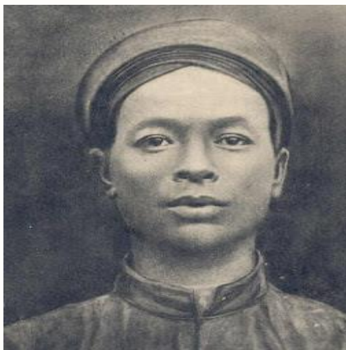
Ba Biều khăn đóng có chữ “nhập”

Khăn đóng của những hạng người khác có chữ Nhập 入 có nghĩa là nhập vào,