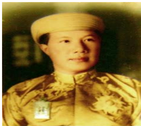
Hoàng đế Bảo Đại

Ở dưới những vòng đó, khăn của vua có thêm 1 vạch, tượng trưng cho chữ nhất,